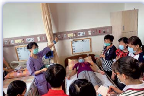
▲ 照顧服務人員訓練班臨床實習

指標數值分析及報表書寫課程1班、109照顧服務員身心障礙支持服務核心訓練課程1班、110年長期照顧足部照護服務訓練課程1班、拳擊有氧訓練班2班，共計40班。各項課程報名踴躍且頗受好評，其中護理類型研習課程證照通過率高達99%，照服人員職類學員取得結訓證書比例達100%，訓後就業率達83%，成果非凡。