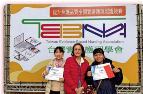
▲2020年考科監實證醫學資料庫微電影活動獲獎師生合影