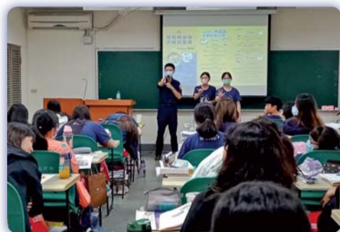
▲「求職防騙暨就業隱私宣導」講座—宣導165反詐騙專線有獎徵答活動