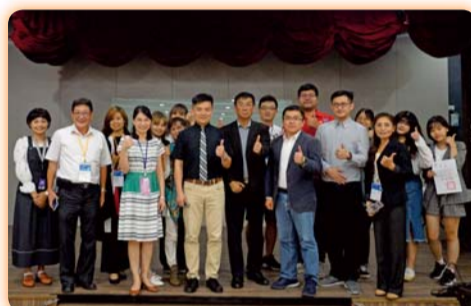
▲ 化妝品技術創新研討會暨壁報論文競賽，參與者踴躍