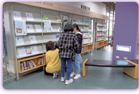
▲同學於主題書展區欣賞師長分享之推介文