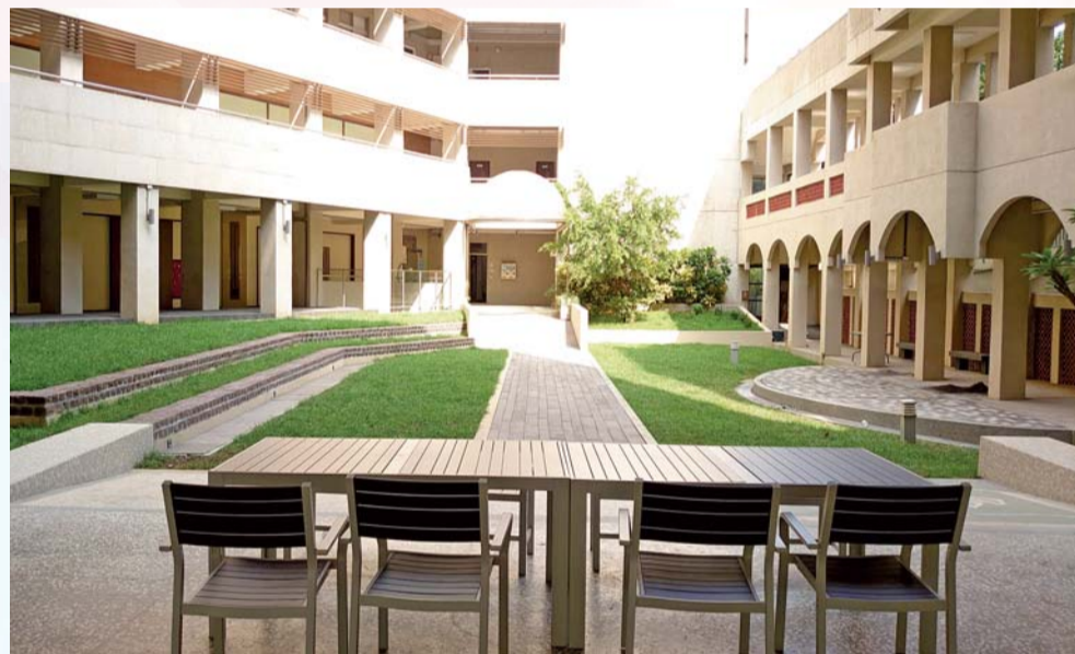
改建後的妝園全景

經費 1,027 萬 8,145 元，教育部補助 770 萬元，「弘景樓及蔻思樓中庭多功能展演空間工程」改造金額編列 600 萬元，由翁廷楷建築師規劃設計，作為戶外展演活動、音樂及舞蹈性社團成果發表的舞台場地。