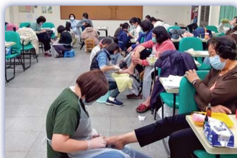
▲ 長期照顧足部照護服務訓練課程學員練習