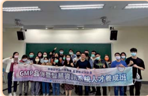
▲ GMP品保暨智慧資訊系統人才養成班結訓合照