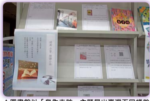
▲圖書館以「島內走訪」主題展出臺灣不同樣貌之圖書資料

悉的記憶味道和創新的驚喜，尋找島內自然生態與環境的奧妙，體驗專屬的臺灣味。並透過校內師長撰文推介分享館藏，引導學生抒寫書籍閱讀與實地踏訪的喜悅與感動，引發同儕共鳴感，帶動校園走讀地方與書寫情懷之風氣。