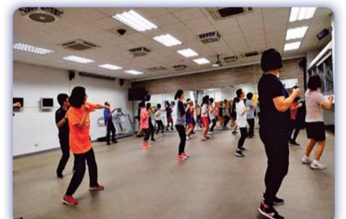
▲ 拳擊有氧訓練班學員上課情形