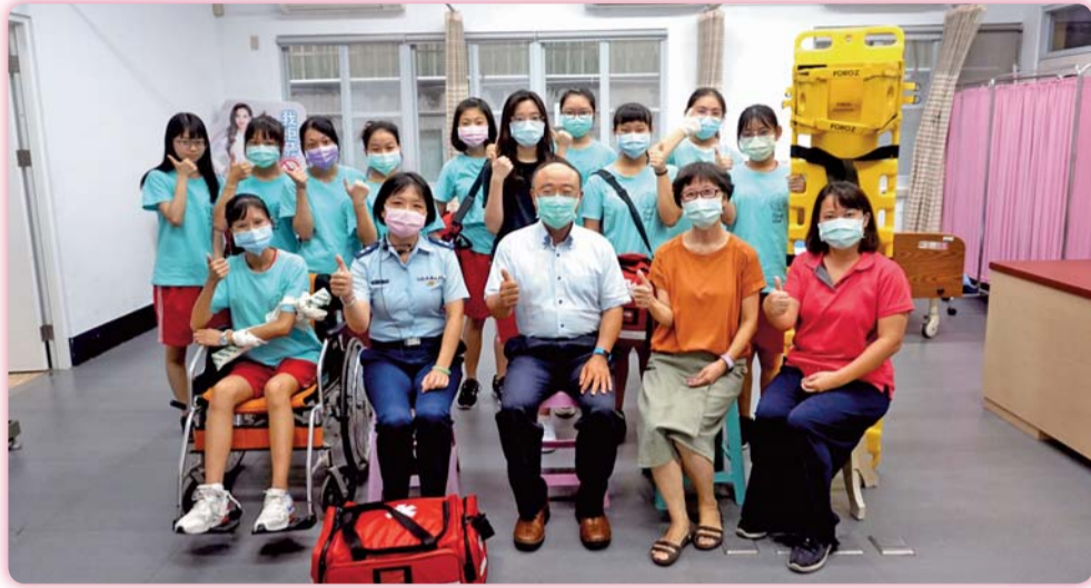
▲ 配合疫情指揮中心秋冬防疫措施，「921防災演練」口罩防護不可少

保服務社及保健志工的協助及師生同仁的參與及配合，讓國際疫情嚴峻的時刻，我們保有健康平安的校園。