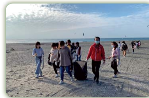
▲淨灘活動實踐環境教育，體驗環保的精神