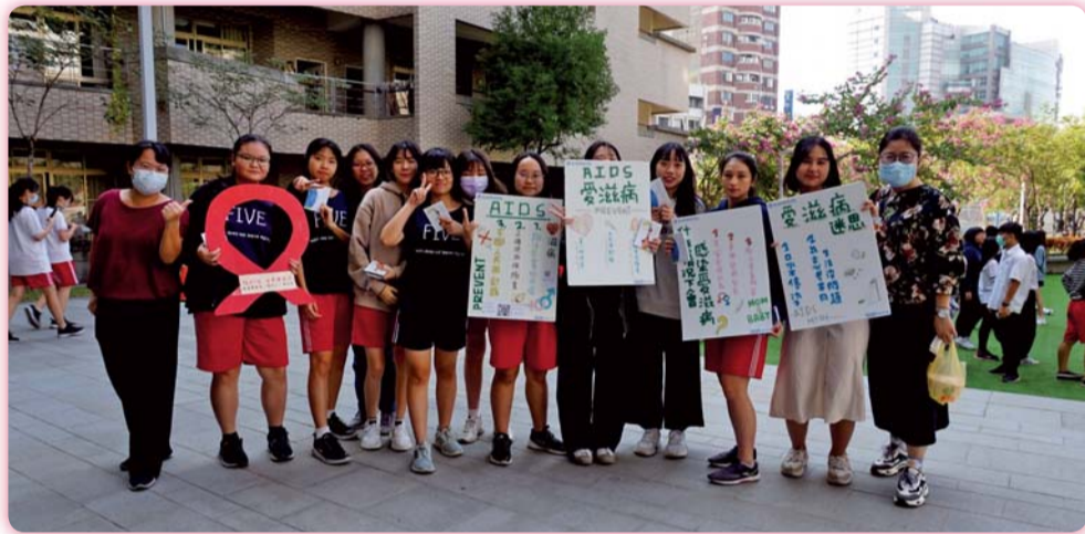
▲ 響應世界愛滋日，愛滋防治宣導打卡拍照活動