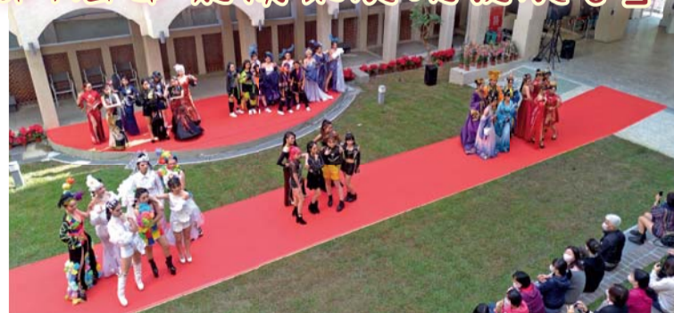
▲在新啟用的妝園舉行之妝品科畢業成果展演發表會