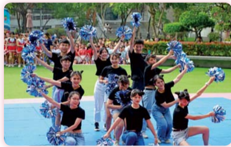
▲ 趣味啦啦舞競賽精彩演出

一致讚揚，觀賽師生亦讚不絕口，若想觀賞當天競賽演出，歡迎進入 https://sites.google.com/ntin.edu.tw/lala109 。