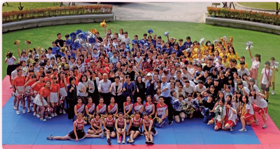
▲ 師生大合照 (趣味啦啦舞競賽)