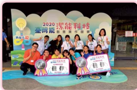
▲榮獲「2020年臺灣能一潔能科技創意實作競賽」高中職微電影組2組佳作獎