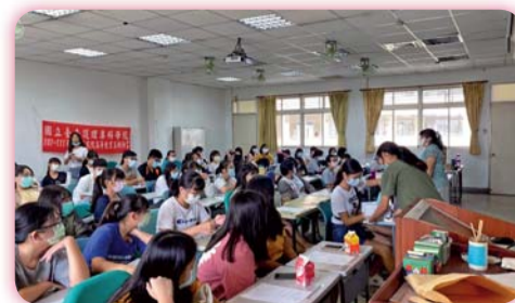
▲ 認識病毒課程(有獎徵答互動)