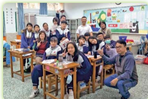
▲本科教師至台中和平國中(原住民重點學校)進行110學年度成立原住民專班招生宣導