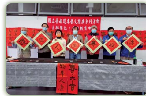
▲校長與通識教育中心教師群一同寫春聯迎春趣