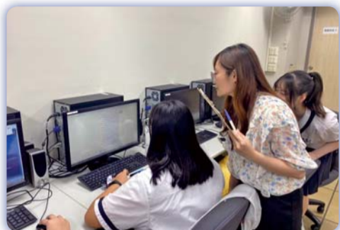
▲UCAN團體施測-協助學生瞭解並分析UCAN測驗結果

三、本校於109年3月辦理學生海外就業面試，3位參與面試之老人服務事業科五專應屆畢業生全額錄取，因疫情因素，2位同學延至109年12月報到，日本青藍會法人組織近日回覆畢業生目前係一邊念書並預計於今年2月1日至集團旗下長照單位工讀，機構對於本校畢業生積極認真學習及誠懇服務態度讚譽有加。