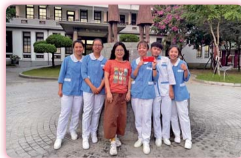
▲四年三班同學作品「膝關節居家練習器」榮獲2020年全國競賽「呼朋引伴、創造未來」創新設計競賽金牌獎