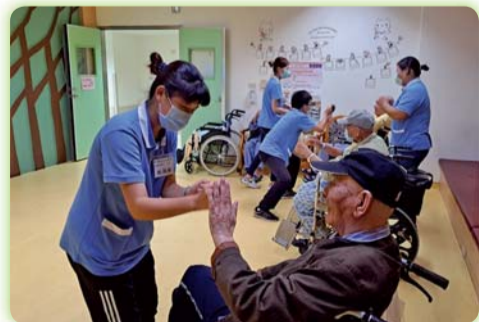
▲學生於暑假期間至機構實習帶領長輩做運動