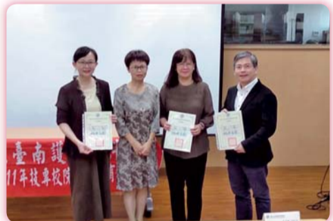
▲ 評審委員與教師發展中心主任合影