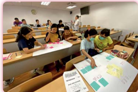
▲ 講者與學員互動討論分組腦力激盪