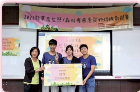
▲榮獲2020龍華盃生態森林療育套裝行程規劃競賽佳作獎