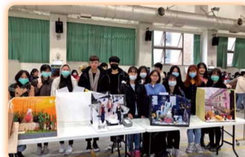
▲ 全國創意調香競賽，鼓勵學生研究，開發臺灣亮點