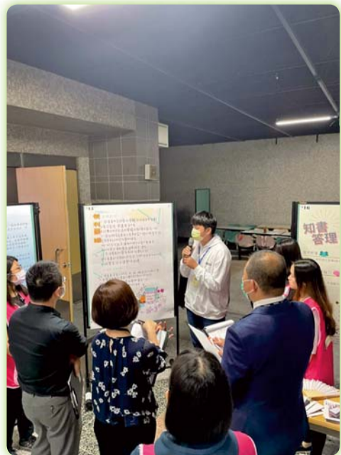
▲學生至長庚科技大學高齡暨健康照護管理系參與老人福祉產品服務創新設計競賽-學生解說參賽創新物品與評審互動過程