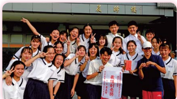
▲ 最佳創意獎外，也是最佳愛校獎—唯一穿校服比賽的隊伍