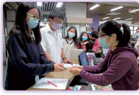
▲同學踴躍參與活動，排隊繳交閱讀分享單