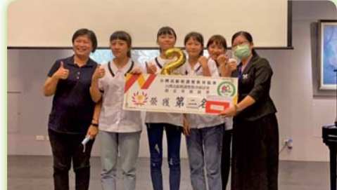
▲學生參加2020高齡照護暨教育協會辦理之創意專題競賽榮獲佳績