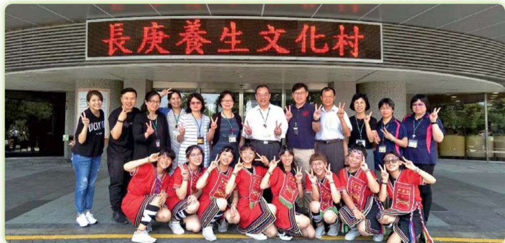
▲學生於暑假期間至長庚養生文化村社工實習後合照