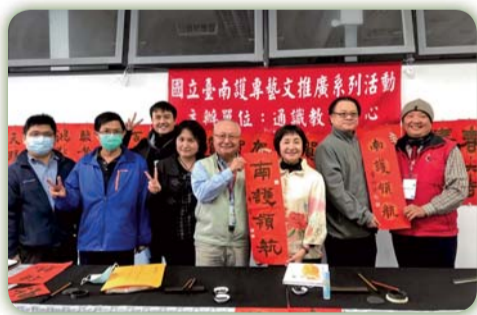
▲書法名家現場揮毫贈春聯