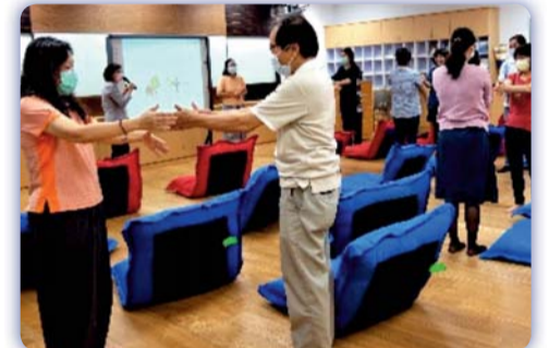
▲ 正念覺察及自我照顧活動過程