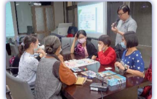
▲ 從《長照規劃師》瞭解桌遊設計活動操作過程