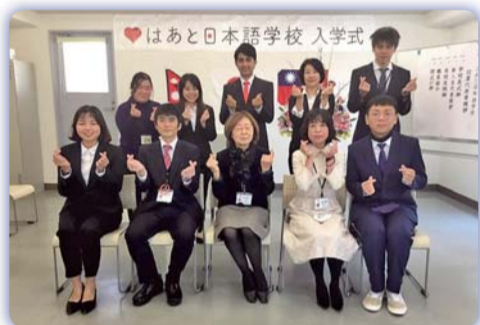
▲日本海外就業—畢業生與青藍會法人組織幹部合影