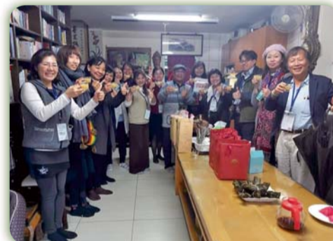
▲ 長治百合希望小書房合影