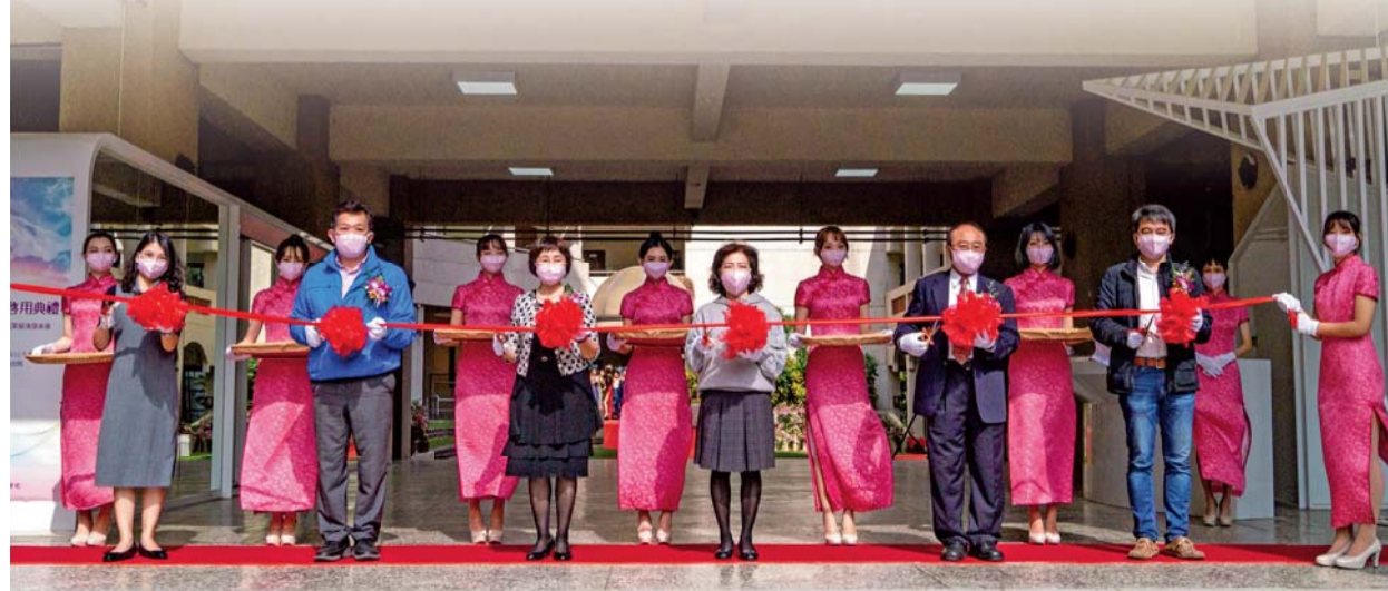
▲「妝園展演空間啟用典禮」暨「第7屆畢業成果展演發表會」，黃美智校長(剪綵者左三)邀請教育部技職教育司楊玉惠司長(剪綵者右三)蒞臨剪綵啟用

109年12月18日舉辦「妝園展演空間啟用典禮」暨「化妝品應用科第7屆畢業成果展演發表會」，活動地點在「妝園」及蔻思樓美膚教室。啟用典禮特別邀請教育部技職教育司楊玉惠司長蒞臨剪綵；是日妝品科畢業展-「FERMATA暫停再繼續」，配合「妝園」舞台氛圍，完美呈現妝品科作品的創新與復古萬種風情。