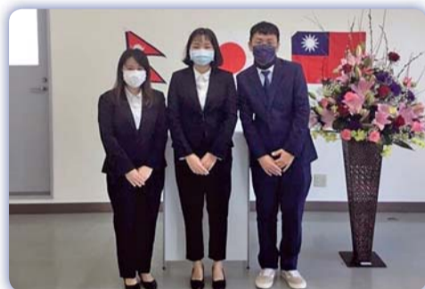
▲日本海外就業—參與本計畫畢業生合影