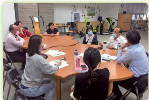
▲本科教師於日間照顧中心與專家召開原民班諮詢會議