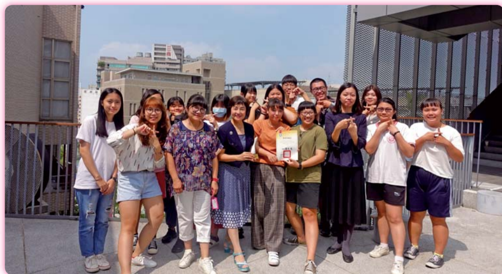
▲護科會榮獲109年全國大專校院社團評選甲等獎-科會幹部與校長、主任合影

配方設計、萃取或檢驗技術、化妝品產業管理相關領域，競賽組別分成三類：創新科技及配方設計、創新原料及萃取技術和創新美藝及產業管理。本校獲得「創新原料&萃取技術」第一名及佳作乙名、「創新科技&配方設計」第二名及佳作兩名，共計5個獎項。