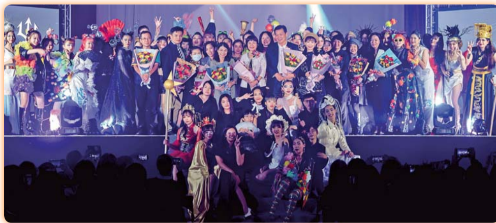
▲ 第七屆學生畢業成果展演動態展主題為「FERMATA暫停再繼續」