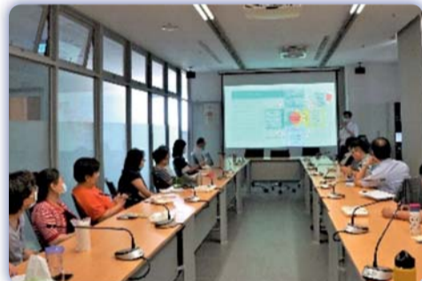
▲ 跨域高齡服務的理念與實驗研習