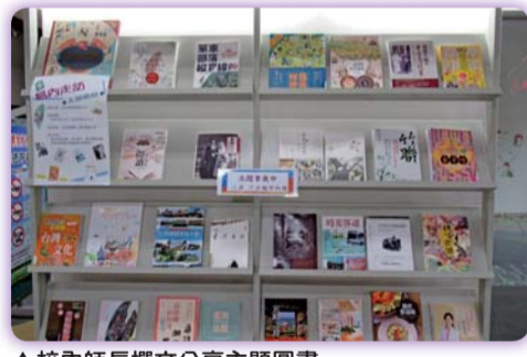
▲校內師長撰文分享主題圖書