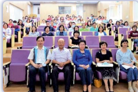
▲ 政府總體長照人力之具體規劃研習後合影

涵，開拓照護新合作夥伴，本校與輔英科技大學及9家長期照顧機構簽訂合作意向書，並由本校教師組成跨域照護品質輔導團隊進行輔導作業，藉由實際參與活動與計畫，增加教師長期照護之產學量能。長期照顧實務技術研究中心亦針對各項計畫需求，舉辦35場學術研討會，邀請國內產官學界專家學者蒞臨本校演講，以強化教師研究和教學知能，拓展多元服務層面。