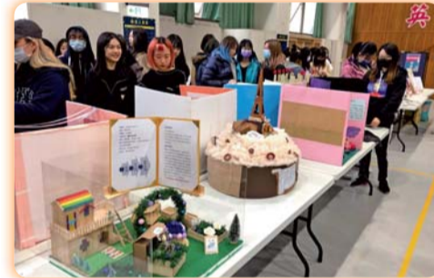
▲ 全國創意調香競賽，鼓勵學生研發的潛力