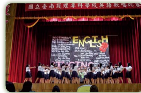
▲英語歌唱比賽活動花絮二