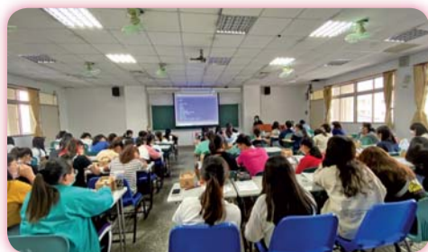
▲ 強化英文課程教師與學生互動