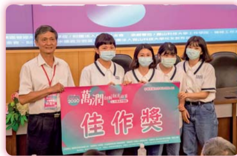
▲五年五班2組創新作品獲「萬潤2020創新創意競賽」2組佳作獎