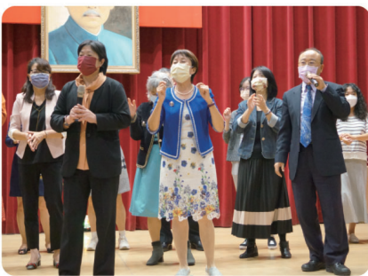
◀校長偕行政主管及貴賓共同獻唱

包含30位退休人員回校歡聚，在美食、美聲與美意中落幕，期盼新歲職場與家庭圓滿如意。