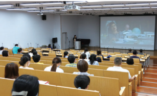
▲性別平等教育知能研習活動花絮

為提升校內教職員性別平等教育知能，落實友善校園，本校人事室於110年11月9日舉辦