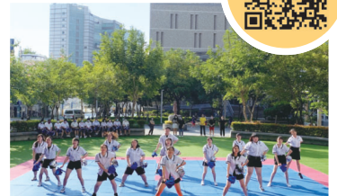
▲趣味啦啦舞競賽精彩演出及師生大合照