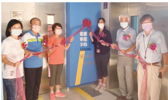
▲健康樂能中心揭牌儀式