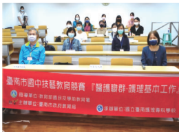
▲醫護職群—護理基本工作