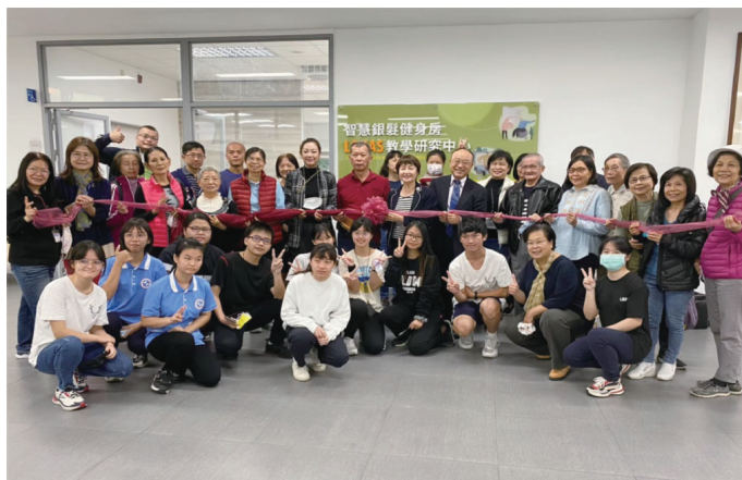
▲邀請社區長輩共襄盛舉