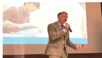
▲英語自傳講座講者