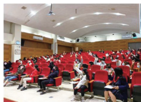
▲「UCAN解測—職業興趣探索及共通職能解析(II)」