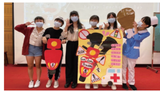
▲英語話劇比賽活動花絮