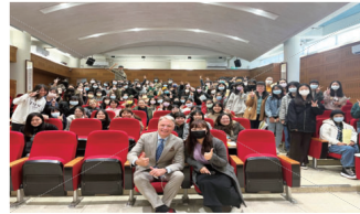
▲英語自傳講座團照