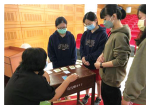
▲「跨專業人生抉擇」—講師於活動結束後，協助同學以OH卡牌卡自我探索。