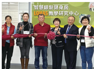
▲智慧銀髮健身房LOHAS教學研究中心揭牌儀式

本中心建置大大增進學生們在體適能領域知識與學習力，在教師群方面則應用雲端大數據分析，除精進教師研究力外，也能延緩長者認知能力退化，提升自我照顧與生活品質。