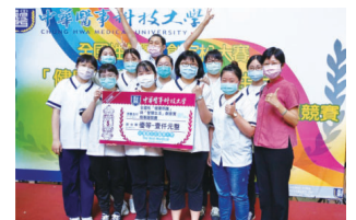
▲2021全國性華醫創客松大賽「健康照護」與「智慧生活」創意實務專題競賽優勝獎