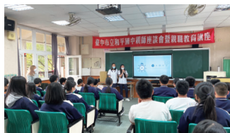
▲臺中市和平國中入班宣導/五專原住生專班學生分享