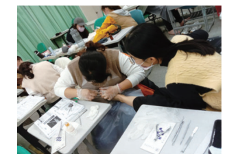
▲長期照顧足部照護服務訓練班—操作練習