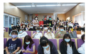
▲「健康耶誕抽抽樂」，安慰緊繃情緒