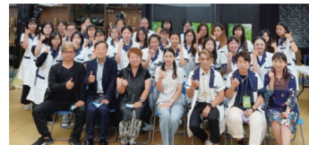
▲▼本科舉辦「韓國歐盟頭皮健康管理師認證課程」，邀請韓國國際美容家總聯合會(簡稱IFBC)和臺灣黃儀生生物科技有限公司合作蒞校協辦。