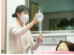
▲術科考試—鼻胃管灌食