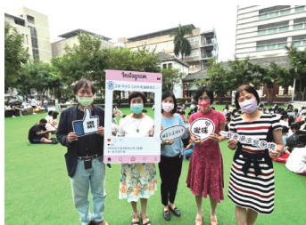
▲師長倡導心理健康標語

獎作品，關注校園心理衛生，有助了解輔導資源，並透過學生創意設計傳播正向能量。亦安排【愛的小卡-把愛傳下去】，手持祝福小卡，傳遞力量；有獎徵答及摸彩活動，促進瞭解本校學生輔導中心，師生共同倡導心理健康標語，在感動及愉悅中期待來年相會。