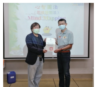
▲教務主任頒發感謝證書

第二場次於110年11月05日邀請將心智圖法正式引進華人世界的第一人孫易新老師，傳授老師將心智圖用於思考、學習、與創意解決問題。講師逐步示範Xmind8.0心智繪圖軟體從下載到線條、圖形、插圖、主題命名、概念間連結線等功能技巧，此場講座滿意度高達4.70分(滿分5分)。兩場活動均有助111年度教育部教學實踐研究計畫申請意願，截至110年12月13日本校共計21位教師申請。