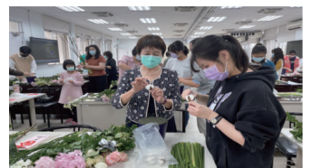
▲校長與師長群同歡