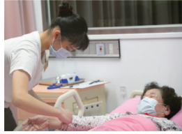
▲術科考試—生命徵象測量