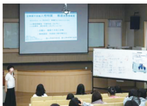
▲「UCAN解測—職業興趣探索及共通職能解析(I)」