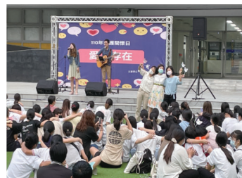
▲校長、學務主任及教官與學子齊聲歡唱