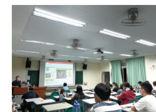
▲社工學分班—分組討論報告