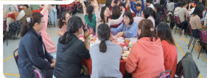
同仁共度歡樂圓滿時光