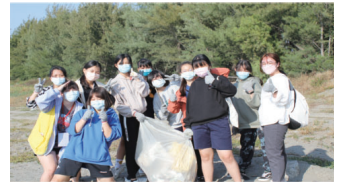
▲淨灘喚起減塑意識