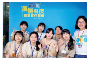
▲「2021年臺灣能-潔能科技創意實作競賽」高中職微電影組銅牌獎師生合影