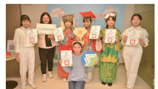
▲榮獲2021空品知識、行動與創意競賽第二名