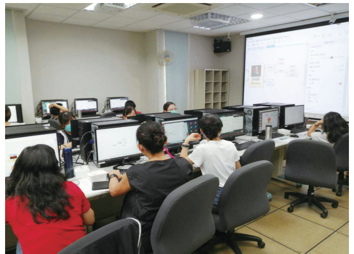
▲屏氣凝神學習心智圖法