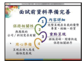
▲「覺醒吧！我的求職超能力—履歷撰寫與面試技巧」—提供面試前資料準備圖表，指導面試資料準備重點。