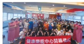
▲與會嘉賓開幕大合影

校長強調身體健康是追求個人生涯成就之基石，應重視體育活動，希望本校教職員工生，能善加利用。特別感謝教育部挹注經費，協助改善老舊建築，期能帶來更安全、妥善之環境，活絡校園運動健康風潮。