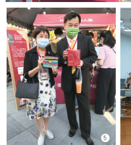
▲本校黃美智校長與崑山科大李天祥校長合照