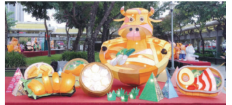
▲「2021臺北花燈」，榮獲高中職組優等