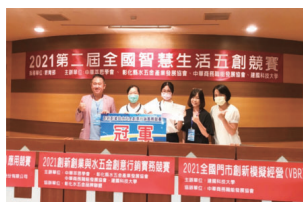
▲榮獲2021第二屆全國智慧生活五創競賽冠軍