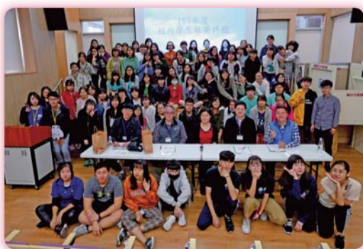
▲ 社團評鑑裁判與社員代表合影

南護各社團一向表現優異，有口皆碑，但評鑑難免有遺珠之憾，期待明年可以看到社團更精彩的成就，加油！