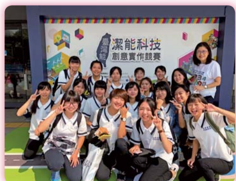
▲ 參與潔能競賽師生合影

二、醫護英文創意設計：由「醫學英文」課程執行，本科全體四年級學生參與，學生先分組進行主題之創意發想討論，決定海報主題與目的，主題可任選與健康促進相關的醫療護理情境說明、護理指導或健康宣導等，透過全英文海報的方式將作品的内容與創意呈現出來，達到溝通與分享的目的。