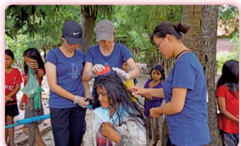
▲ 國際志工社員協助當地居民清洗治療頭蝨

10天過去了，揮別柬埔寨，也揮別了我們的國際志工初體驗，離開前孩子們特別為我們製作了小卡片，寫上滿滿的祝福跟感謝，強忍在眼眶裡打轉的淚水，張開雙手擁抱逐一道別。這次服務的經驗讓我們瞭解，偏鄉弱勢的孩子需要大家為他們創造機會，讓他們在教育學習上能獲得公平的對待。從事志工服務不是去比較彼此的環境，而是學會對彼此生命的尊重，謝謝團員們敢於做自己，更謝謝協會的幫助，也期望將這份美好的經驗繼續傳承下去。