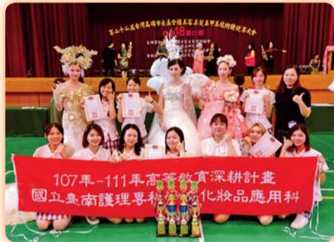
▲ 第22屆高雄市美盃參賽師生合影