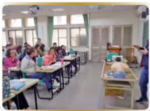
▲ 心肺復甦技術講解