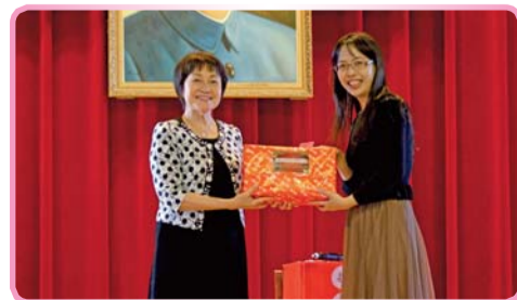
▲ 校長與幸運贏得頭獎同仁合照