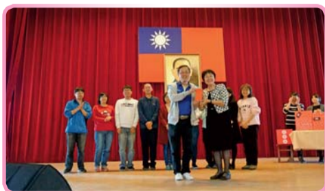
▲ 教務處同仁上台歡唱同樂