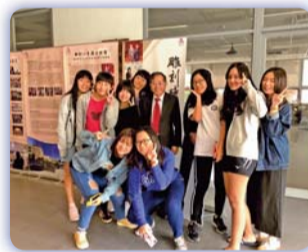
▲ 陳前校長與參觀同學於檔案展前合影