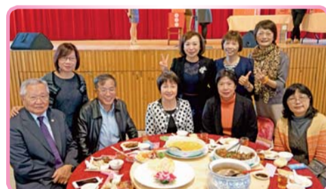
▲ 各單位貴賓蒞會共聯歡