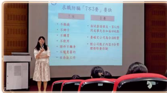
▲ 職場性別平權暨求職防騙自我保護講座