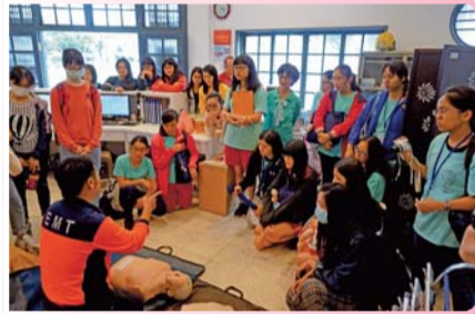
▲ 參訪臺南市政府消防了解醫療服務資源系統