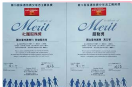
▲ 社團服務獎-保健服務社