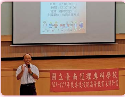
▲ 兼任教師座談會李副校長致詞