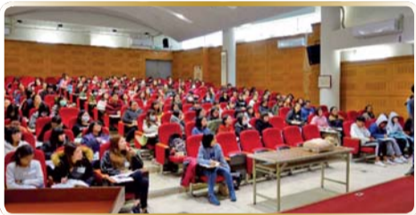
▲ 高級心臟救命術ACLS課程概論講授