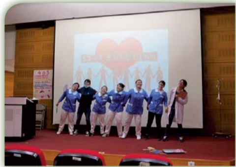
▲ 英語話劇比賽活動花絮

生命教育講座及大體解剖教學參觀對學生而言是一個非常難得的經驗，在學校學習時受限於教學教材，只能觀察標本、模型，缺乏真實感，學生僅能憑藉想像力，揣測人體結構的模樣，但透過教學活動的進行，學生可以把在課堂上所學的與人體做連結，更容易認識各個器官的組成及特質；還能夠體會到生老病死尊重生命。