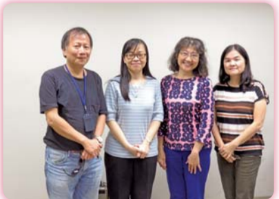
▲ 數位教材軟體Camtasia製作工作坊