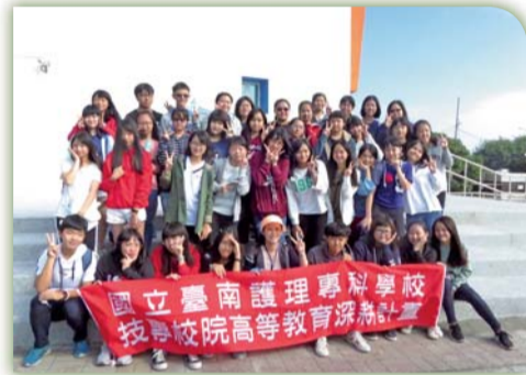
▲ 黃金海岸淨灘活動花絮