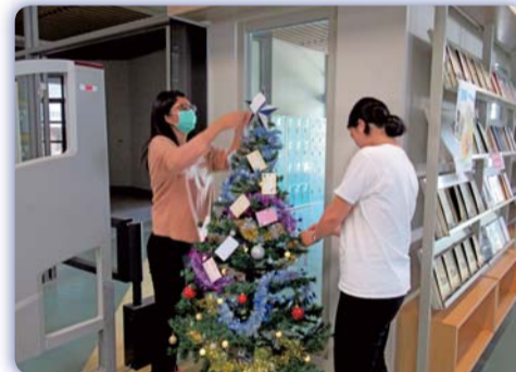
▲ 同學親手將祝福卡繫在聖誕樹上