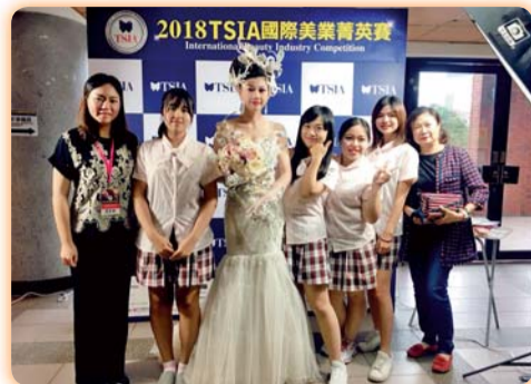
▲ 2018TSIA國際美業菁英賽參賽師生合影