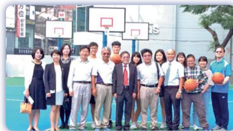
▲ 籃球場啟用後師生合影

同學能多多練習投籃。採用藍綠色壓克力地坪，搭配白色「天使翼牆」，充滿活力的造型及亮麗的色彩，讓南護這些天使們在蔚藍的天空下，翩翩起舞乘著風讓夢想起飛。未來籃球場地除了讓同學打籃球外，亦將是恢復南護多年來拔河及啦啦隊傳統的比賽場地，是另一個多年後同學們回憶的空間。