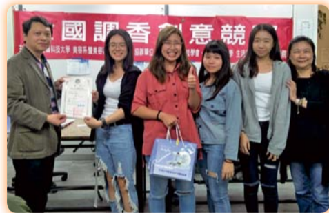
▲ 全國調香競賽參賽師生合影(二)