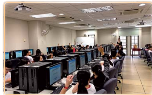
▲ 辦理一年級學生進行UCAN團體施測