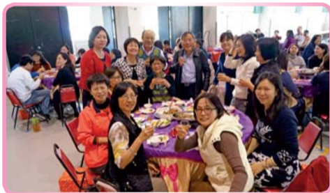
▲ 同仁共度歡樂圓滿時光

另外為感謝平時大力協助學校各項實習業務之醫療院所，特邀相關單位參與同樂，共享年節歡樂氣氛；計有臺南市政府衛生局科長、臺南市立安南醫院、國立成功大學附設醫院、臺南市立醫院、衛生福利部臺南醫院、臺灣首廟天壇、晉生醫院、郭綜合醫院等各單位貴賓蒞會，使得活動倍增光彩。與會貴賓有感於校方熱情招待及現場歡樂氣氛，紛紛捐贈摸彩禮卷及獎金，掀起更多的掌聲及歡呼聲。聯歡會在美食、美聲和美好心情中落幕，新的一年期盼同仁職場與家庭事事圓滿如意，身體健康平安。