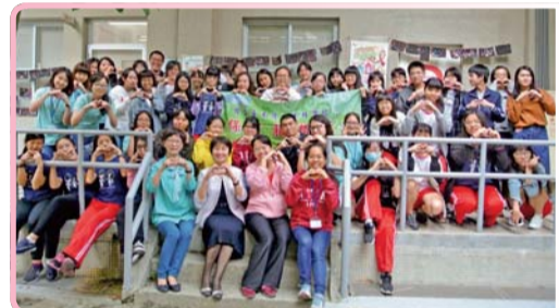
▲ 與愛同行-校長（前排左二）帶領愛滋防治活動，大手牽小手，守護校園健康