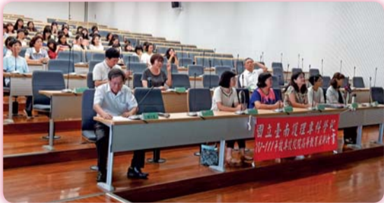
▲ 『新新相習』教師節新舊融合暨教師成長研習活動

教師發展中心致力於提昇教師之教學專業品質、協助教師之自我成長並提昇教師教學實務實踐研究品質與能量。未來會提供更多服務，以達提升教學成效、促進教學實踐研究。