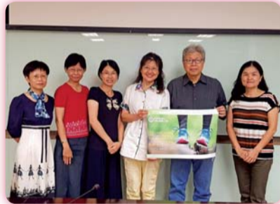
▲ 教學實踐工作坊—我的踏實之路