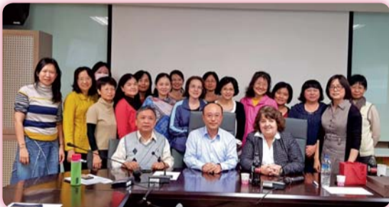
▲ 『Writing to Publish』講座