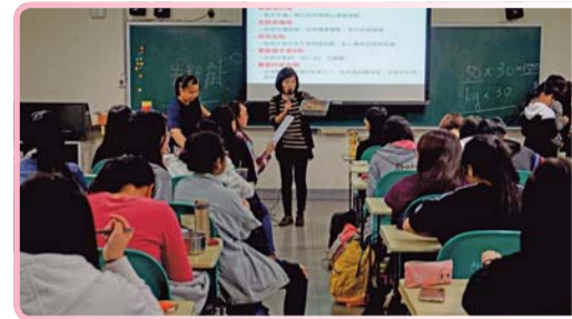
▲ 健康飲食入班同行-營養學老師於用餐時間介紹食物營養素及均衡飲食重要性