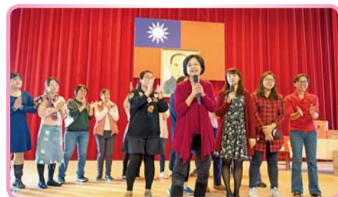
▲ 實輔處同仁上台歡唱同樂