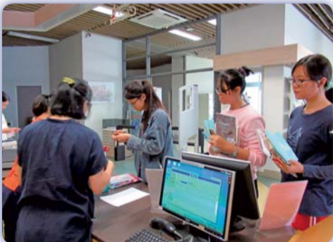
▲ 工作人員確認同學的任務完成度

福的心。同時以尋寶遊戲方式，引導學生依任務提示，查找圖書、期刊及電子圖書等三種館內資源，在遊戲中腦力激盪，完成任務，不僅認識圖書館資源，亦添加閱讀樂趣。