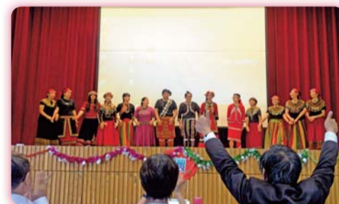
▲ 原住民族同學表演「南系之王」舞蹈