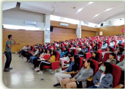
▲ 環境教育講座活動花絮