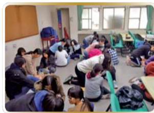
▲ 心肺復甦技術操作練習