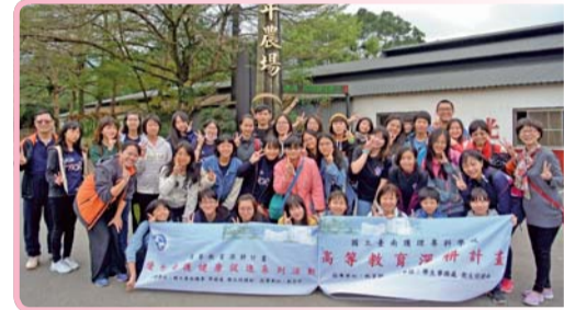
▲ 優化健康促進課程-身體力行，健康齊步走