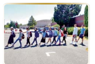
▲ ESL大地遊戲 認識朋友