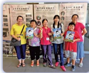
▲ 陳前校長與參觀校友於檔案展前合影