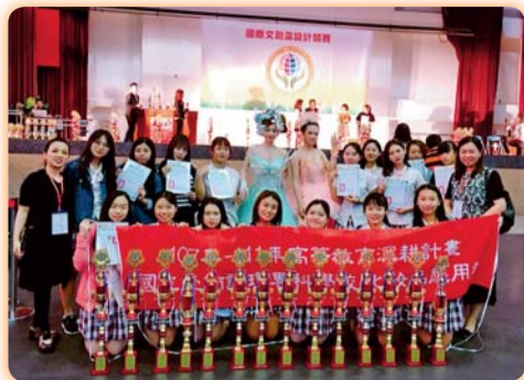
▲ 2018第5屆國際文創盃美學設計競賽參賽師生合影