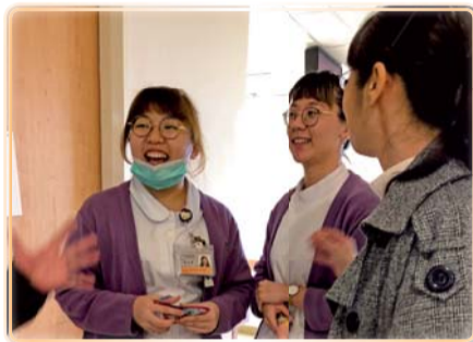
▲ 至振興醫院關懷探視於醫院臨床工作的校友

為協助本校2019各科畢業學生求職面試、履歷準備、職涯規劃及醫院就業獎助學金申請等相關需求，就業輔導組備有多項的諮詢服務，歡迎同學善加利用，以便快速與正確資訊的取得。