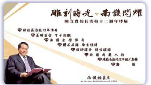
▲ 陳前校長特展網頁入口封面

自100年度起，本校已經連續八年舉辦檔案展，南護的檔案展已在校建立優良的口碑。因為，我們認為檔案不該只是一份冷冰冰的文件，靜靜地躺在檔案室中，而終了一生。檔案是時光的鏡子，照亮了歷史的痕跡，它保留時代的見證以及珍貴的記憶，如果能夠妥善的運用，就可以找