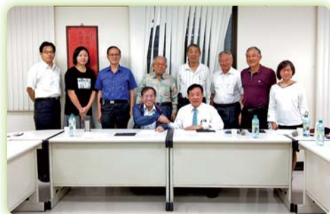
▲ 簽署產學合作案後，雙方與會人員合影紀念