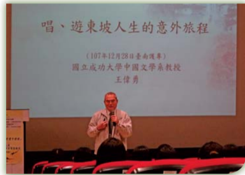
▲ 唱、遊東坡人生的意外旅程活動花絮