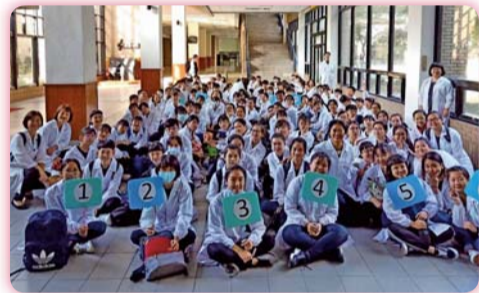
▲ 等待進入參觀情形