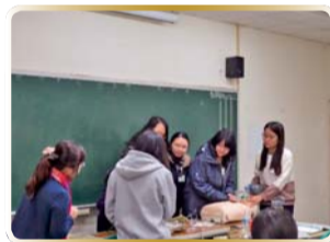
▲ 心肺復甦技術操作練習