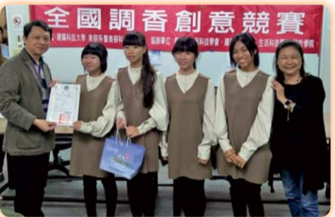
▲ 全國調香競賽參賽師生合影(一)