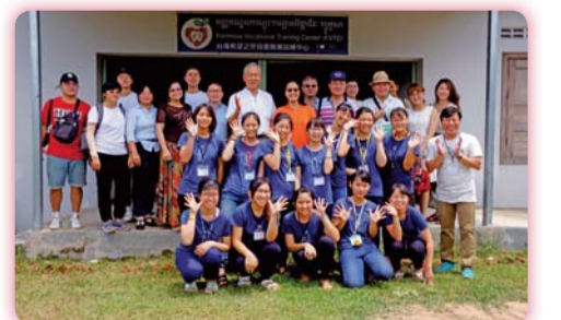
▲ 國際志工社員與希望之芽參訪貴賓合影