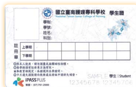
▲ 學生證正面（左）反面（右）