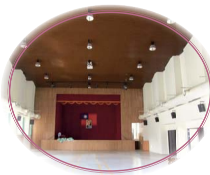
▲D棟活動中心整修完成現況