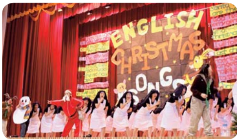
▲ 第三名-五護四年六班