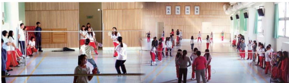
▲合作教育盃羽球比賽團體組比賽實況（一）

（一）團體組：第一名五護四5、第二名五護四6、第三名五護三5、第四名五護二5、第五名五護四3、第六名五護三6。