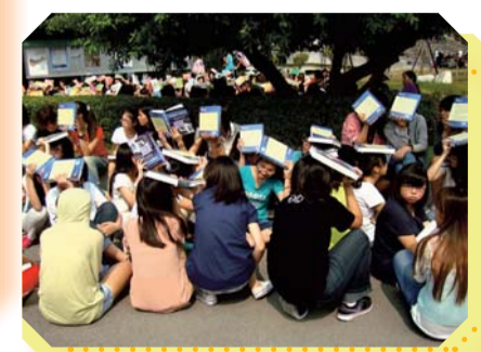
▲地震避難演練，學生依照逃生指示至戶外避難情形