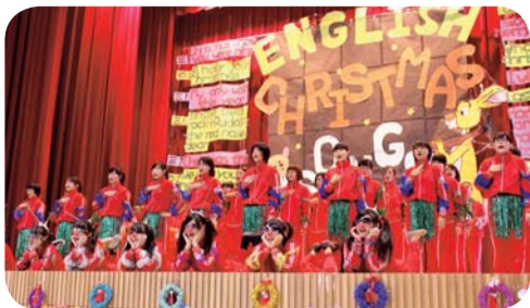
▲ 第二名-五護三年三班