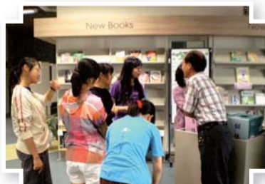
▲101年10月23日讀者滿意度問卷調查抽獎