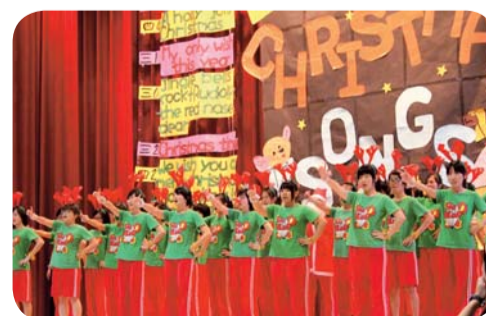
▲第一名-五護三年六班