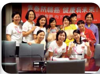
▲婦癌防治向下紮根-種子學生志工培訓