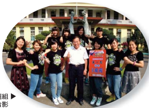
校長與雅梅主任、碧蓮組長及熱舞社參賽同學合影

☆ 熱舞社參加「熱力稅月 鬥牛舞young之舞動稅月租稅熱舞比賽」榮獲全國第一名