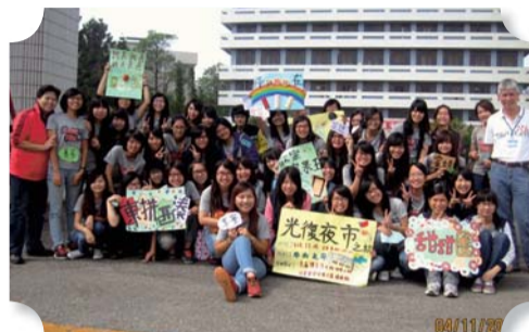
▲四年二班同學於佳里榮譽國民之家服務學習後合影