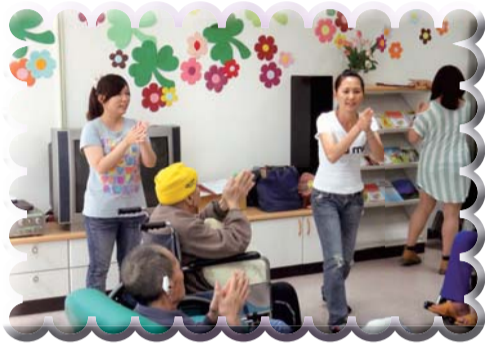
▲學生於長照機構帶領長者做音樂照顧活動