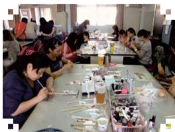
▲101年度3月份舉辦美甲中階實務班課程，學員上課實際操作情形