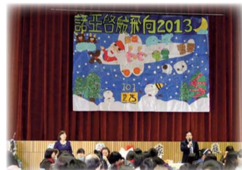
▲溫馨家庭關懷日校長開場