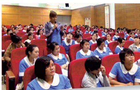
▲實習個案研討會(一)