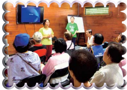
▲官田水雉生態園區健康Easy go民眾健康健走活動-老師上課情形