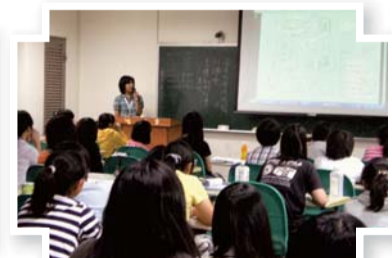
▲101學年度新生圖書館利用指導課程