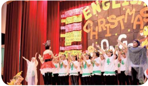
▲ 優勝-五妝三年一班