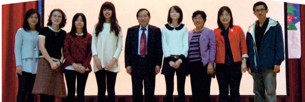
▲校長及教師與獲獎同學合影