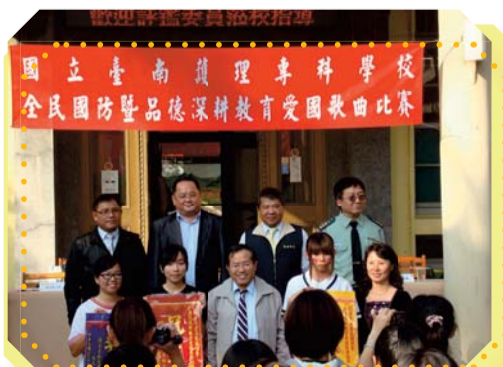
▲全民國防教育暨品德深耕教育愛國歌曲比賽校長評審與得獎合影