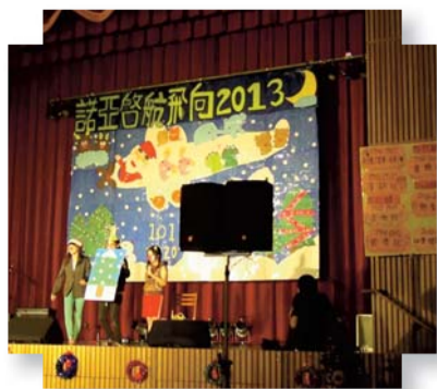
▲康輔社幽默創意的演出