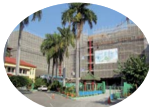
▲「綜合教學暨實習大樓及學生宿舍大樓」新建工程施工現況