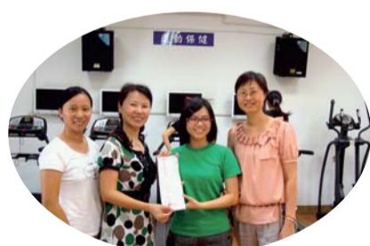
▲雅梅主任及衛保組師長和健康促進活動得獎同學合影

二、101年9月17日-101年10月5日期間，指導學校衛生護理實習的同學每週一到週五10:00-14:00開放健康促進中心，鼓勵全校師生多運動、保健康，師生反應熱烈，使用率高，有四位同學一週運動達150分鐘以上，獲頒精美禮品乙份，以茲鼓勵。