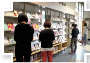
▲101年11月性別平等主題書展