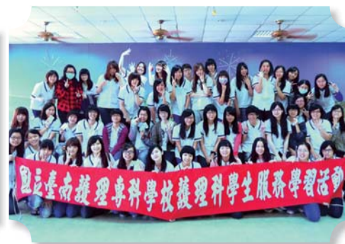
▲四年四班同學於永保安康護理之家服務學習活動後合影