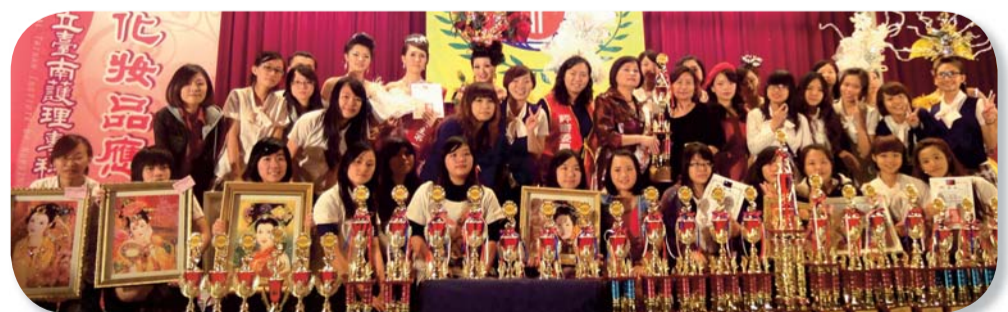
▲ 2012中華盃美容技藝競賽全國總冠軍