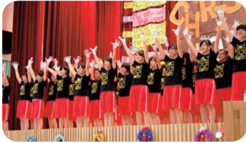
▲ 優勝-五護三年五班

二、為配合101學年度基礎服務學習課程，將搭配內政部「志願服務法」規定，透過課程學習，協助完成志願服務法所規定之基礎教育訓練，參加對象為護理科、化妝品應用科五專一年級及化妝品應用科二專一年級，安排時間為10月19日、11月2日、11月23日每週五的班週會時間（上學期三場、下學期三場訂於3月1日及3月8日），完成者繳交一份心得感想並頒發結業證明書乙紙。目前已完成三場，講題及主講者如表格。