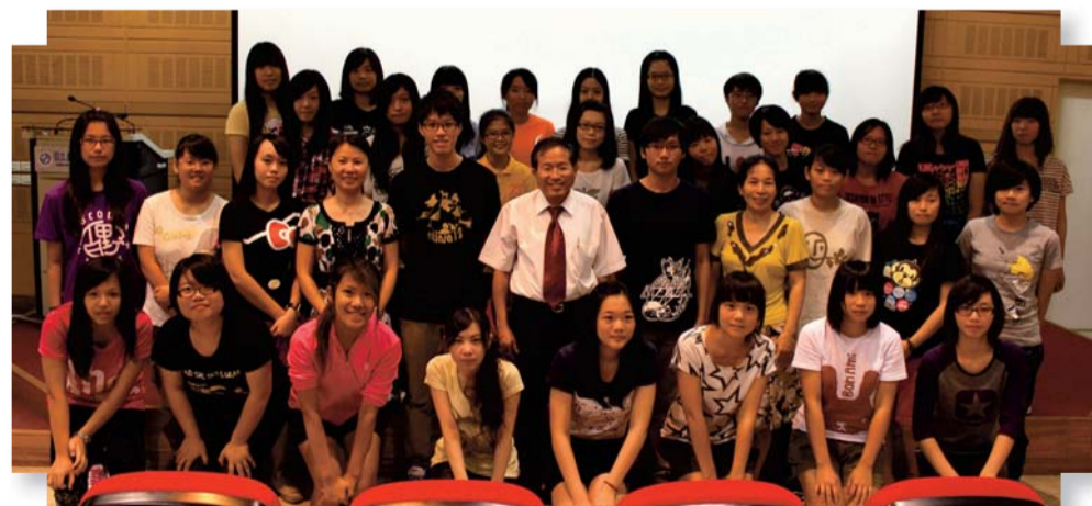
▲校長與101學年度社團長合影