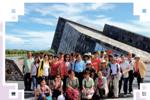
▲101年教職員工文康旅遊