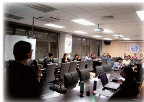
▲講師與導師分享如何與青少年談性

二、辦理溫馨的家庭關懷日活動：101年12月25日中午溫馨家庭關懷日活動，校長、一級主管、各班導師與各班弱勢家庭學生共進午餐，學輔中心並安排感恩向上的大團體活動，展現南護大家庭的溫暖！