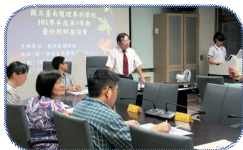
▲校長親自主持兼任教師座談會，說明教育理念及現況