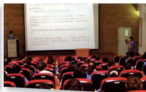
▲實習個案研討會(二)