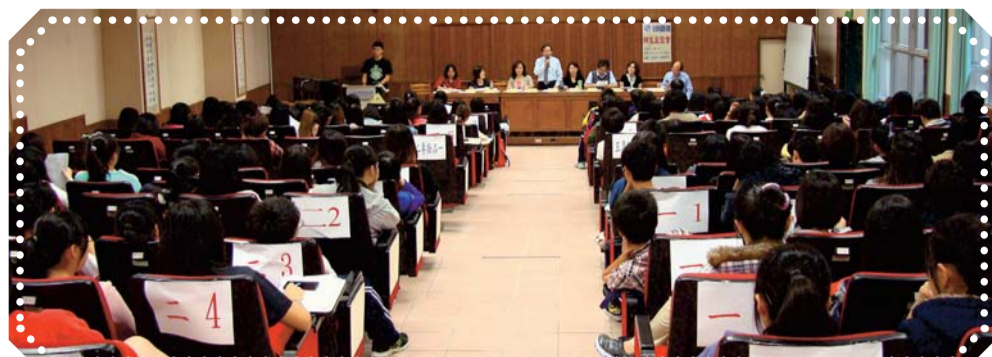
▲師生座談學生踴躍參與，進行良性的雙向溝通