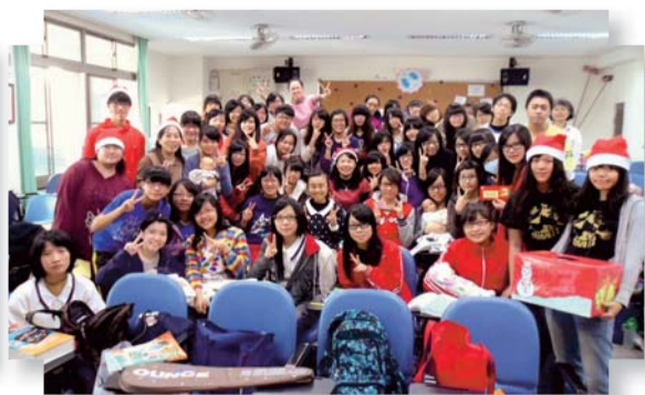
▲聖誕列車為全校師生帶來聖誕氣氛