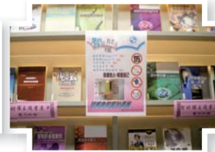
▲101年10月智慧財產權主題書展