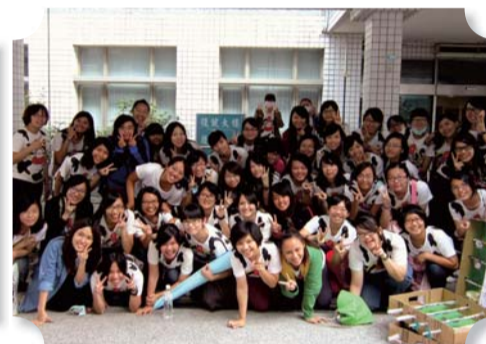
▲四年六班同學於高雄榮民總醫院台南分院服務學習後合影