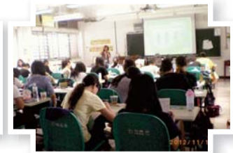
▲101年11月護理科四年級線上資料庫教育訓練課程