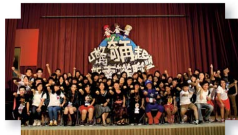
▲迎新晚會後大合照