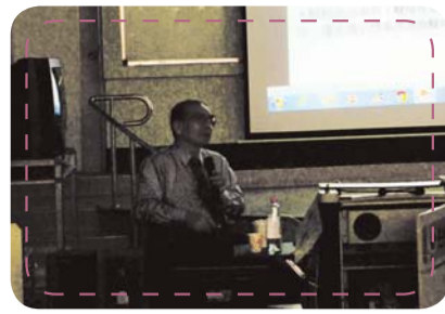
▲臺南市政府消防局吳明芳副局長講授「防震與防災訓練」