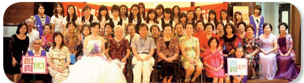
▲ 勾畫繽紛銀色世界活動-銀髮族走秀活動