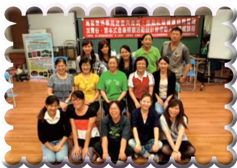
▲加賀宮宮本式音樂照顧活動設計課程老師與全體學員合影