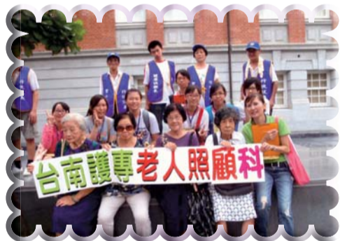
▲老人照顧科學生帶領社區長者於臺南市健康健走活動與社區長者合影