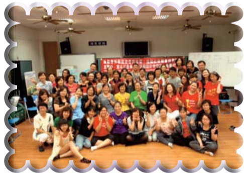
▲加賀宮宮本式音樂照顧活動設計課程老師與老人照顧科學生合影