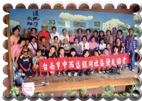
▲官田水雉生態園區健康Easy go民眾健康健走活動與社區長者合影