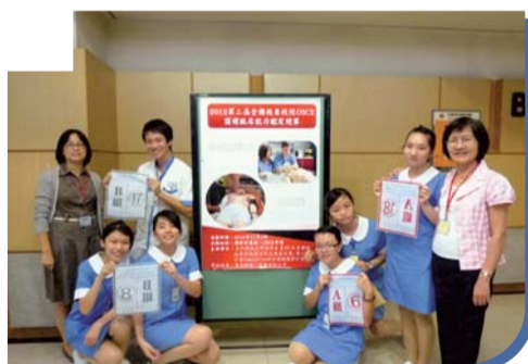
▲參與OSCE護理臨床能力鑑定競賽師生合影