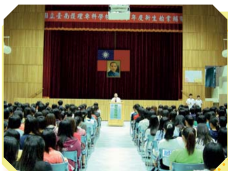
▲新生始業輔導校長致詞