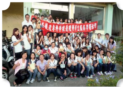
▲四年一班同學於如新護理之家服務學習活動後合影