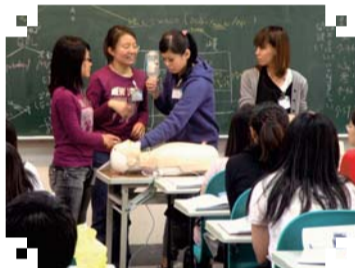
▲101年度12月份ACLS高級心臟救命術研習班學員上課練習CPR情形