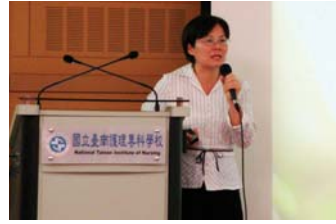
林貴美督導-一路走來的堅持