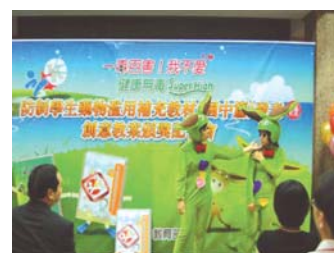
次長與來賓專注欣賞本校同學精彩相聲表演