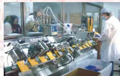
參觀「蕾迪詩-面膜的製作流程」