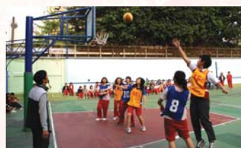
合作教育盃班際籃球比賽之二