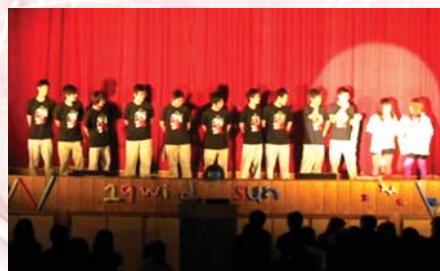
康輔社舉辦社團成果發表會邀請友校前來參加