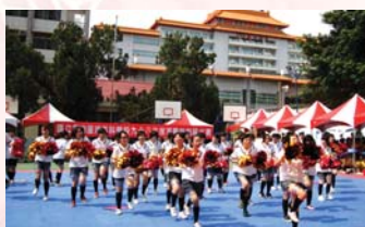
班際啦啦隊比賽之一