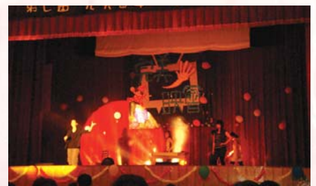
98.5.17手語社於D棟四樓活動中心舉辦完美手映會—成果發表會