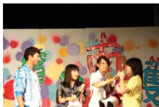
56週年校慶校慶系列活動-校慶晚會邀請藝人賴聖恩至本校同樂-98.6.1