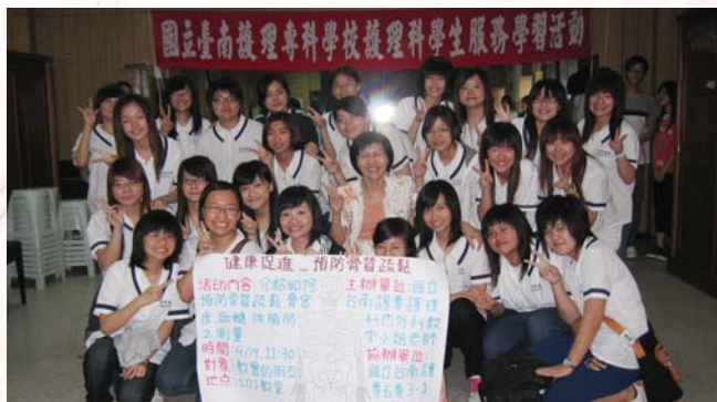
本校師生提供社區健康服務講座與健康服務