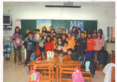
“資”識保健體驗營-活動結束全體合照