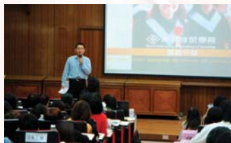
長庚技術學院進行聯合徵才