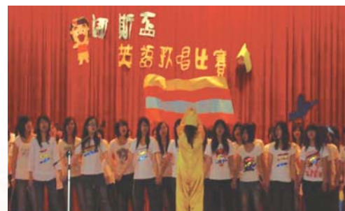
參加「英語歌唱比賽」