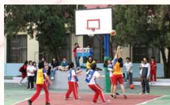
合作教育盃班際籃球比賽之一