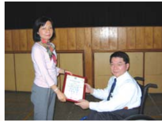
副校長頒發感謝狀給評審

一、為推動生活化、多元化、適性化、統整化之英語教學，本中心援例辦理年度英語歌唱比賽，並定名為「娜斯盃」，藉以提升學生學習興趣，強化學習動機，俾達寓教於樂之效果。今年度之娜斯盃英語歌唱比賽業於98年4月3日下午1:30假本校D棟四樓活動中心辦理，計有13個參賽班級（五專一年級6隊、五專二年級6隊、二專一年級1隊），表演內容之規劃均由學生主導，希望學生發揮創意，成為嫻熟應用英語之新世代人才。各班表現均較往年有長足進步，經過一番激烈角逐，名次如下：第一名：五專一年2班；第二名：五專二年2班；第三名：五專二年3班、二專一年1班；第四名：五專一年1班；第五名：五專二年4班；團體精神獎：五專二年5班。