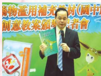
吳次長財順向大家介紹本校編印之教案成果彙編

為推動藥物濫用防制教育，教育部委請本校於98年5月26日假教育部1樓大廳舉辦防制學生藥物濫用創意教案頒獎典禮，由教育部吳次長財順主持，對創意教案競賽的得獎人予以表揚。記者會中本校推出「南護反毒樂不K」相聲表演，深獲好評及媒體報導，期待經由頒獎記者會以鼓勵更多教師自行開發、改編或運用教材、教案，並融入平日教學與班級經營，設計親師生互動的多元教學，以協助、教導青少年因應壓力及誘惑的方法、以達到拒絕成癮物質的目的。