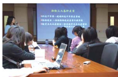
「農業生物科技園區」簡報