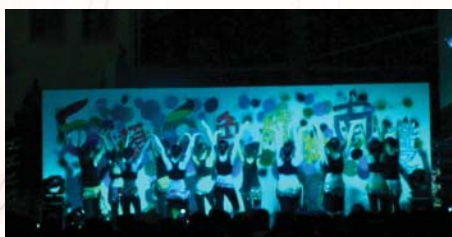
校慶晚會-活力有氧社青春洋溢的演出