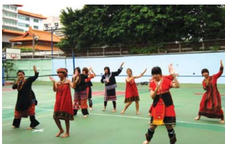
98.5.23原青社於籃排場舉辦“原味 Show”社團成果發表會