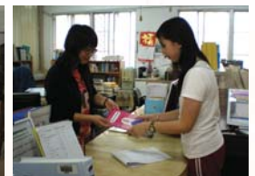
同學登記領取圖書

另為擴充本館可用資源，積極參與各種聯盟合作組織，透過共購共享機制，增加23種線上資料庫可於校區內電腦免費使用，提醒全校師生要多多利用喔！！（請連結圖書館網頁 http://lib.ntin.edu.tw/資料庫 使用）