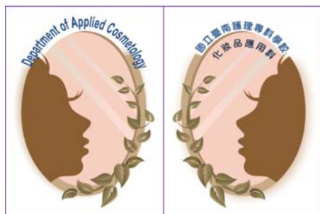
化妝品應用科「科徽」-中、英文版

五、本科舉辦科徽設計比賽，獲選勝出第一名作品，已正式啓用為化妝品應用科科徽，獎學金由化妝品應用科主任贊助，參與競賽者並獲頒發獎學金予以獎勵。