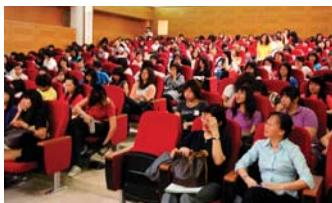
雇主座談會專題演講