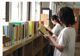
同學挑選自己需要的書籍