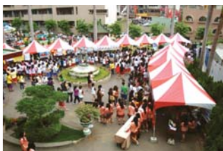
56週年校慶校慶系列活動-園遊會會場－98.6.1