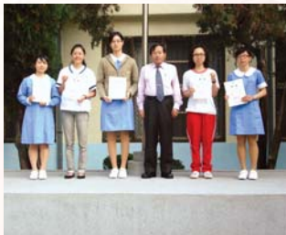
校長主持升旗典禮,頒獎優秀表現之同學