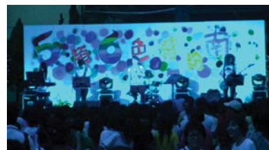
校慶晚會-流行音樂社初次演出