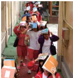
宿舍實施防震防災逃生演練,全體同學參與緊急應變、疏散避難演練