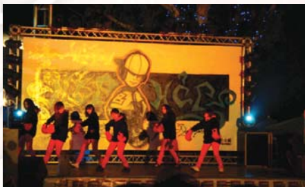
98.5.1熱舞社於南方公園舉辦舞展暨社團成果展