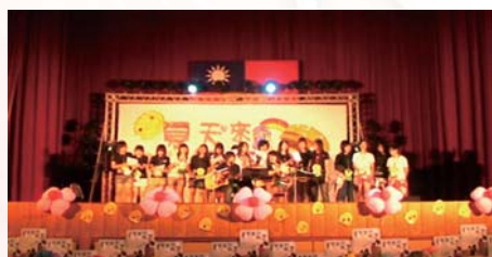
吉他社成發會圓滿結束，社團內全體幹部謝幕