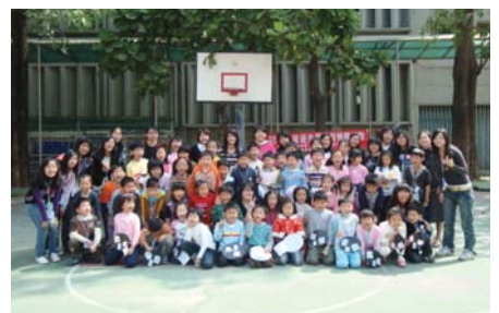
YE! 來首協進曲! 活動結束全體合照

(二) 97學年度第二學期，課外活動指導組辦理多樣化之活動，豐富同學生活的廣度及深度，活動表如下：