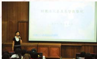
嘉義基督教醫院進行聯合徵才