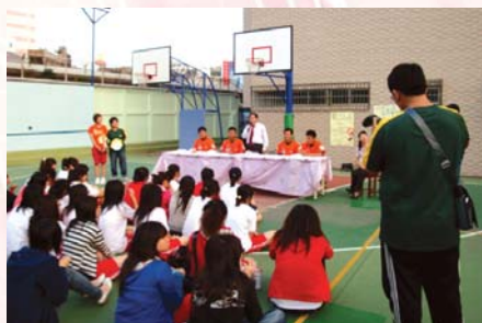
98.2.26棒研社舉辦獅運當頭，棒球饗宴活動邀請到統一獅球員至本校座談