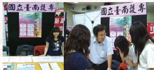
「招生博覽會」招生宣導

八、由本科仇主任及教職員前往上游生源學校招生宣導，已完成高雄、台南、嘉義及中部地區學校之到校招生宣導工作。