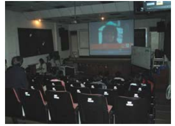
98.3.14百野童軍團第19屆團慶播放自製影片