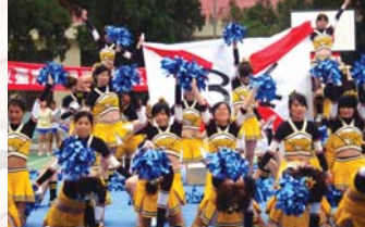
校慶啦啦隊比賽優勝班級表演之二