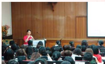
彰化秀傳醫院進行聯合徵才