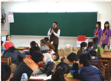
資研社至博愛國小舉辦營隊活動-“資”識保健體驗營，博愛國小校長致詞