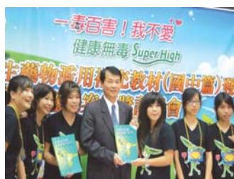
王處長與本校同仁合影

一、98學年度教育部核定招收新生人數450人：五專護理科300名、化妝品應用科日、夜二專各50名、老人照顧科夜二專50名。本校98學年度招生概況及全校學生人數狀況如下：