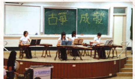
98.5.6古箏社於視聽教室一舉辦絃外之音成果發表會