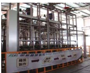
「聯發生技」發酵工廠