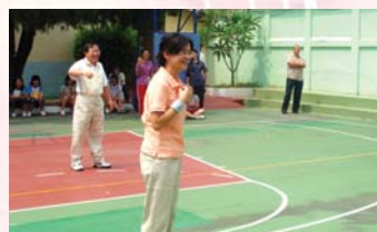
校慶師生排球友誼賽之二