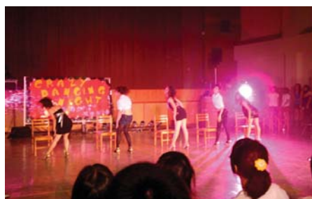
國標社於D棟四樓活動中心舉辦“Crazy Dancing Night”社團成果發表會