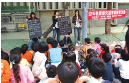
98.1.21-23文藝社至協進國小舉辦營隊活動-YE! 來首協進曲! 進行歌曲教唱