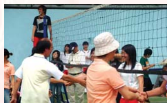
校慶師生排球友誼賽之一