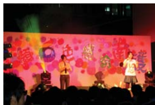
校慶晚會-手語社熱情演出