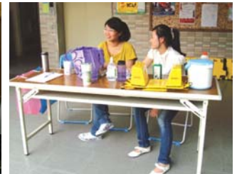
98.05.15急救站志工維護啦啦隊比賽學生安全