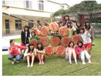
98.3.14百野童軍團於本校舉行第19屆團慶