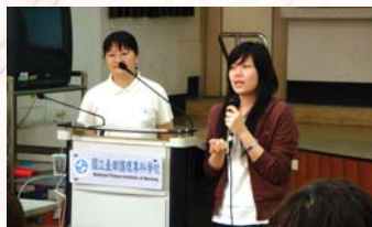
花蓮慈濟醫院校友經驗分享