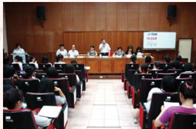
校長親自主持-師生座談會議