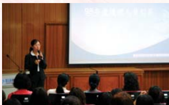
慈濟大林分院進行聯合徵才