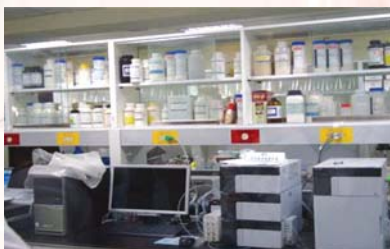
參觀「蕾迪詩-化妝品調製實驗室」