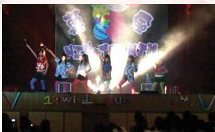
98.5.16康輔社於D棟四樓活動中心舉辦成果發表會—菓風小舖19巷