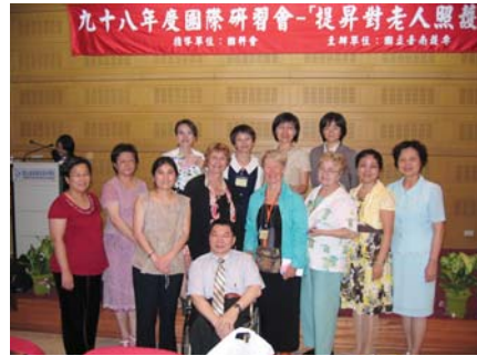
提升對老人照護與溝通」國際研討會

因應高齡化社會的來臨，培育學生具備長期照護與老人照護的實務經驗與參與此工作之熱誠，使接