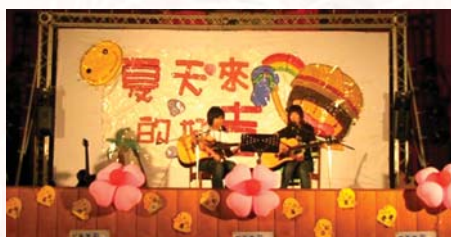
98.6.7吉他社於D棟四樓活動中心舉辦成發會-夏天來的好“吉”