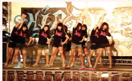
熱舞社於南方公園舞臺上熱力四射