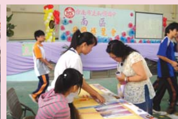
參加多元進路宣導介紹活動

二、教育部核定本校98學年度新增老人照顧科二專夜間部50名。有關新增老人照顧科二專部夜間部之報名資格為高中職畢業生，不限高中職科別，歡迎有興趣之同學踴躍報名。99學年度預定招生名額（480名）如下：