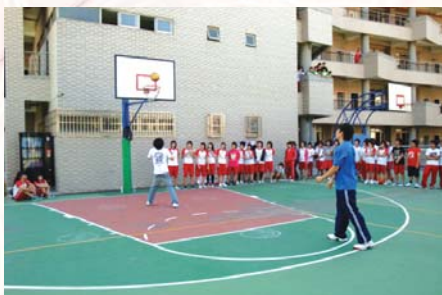
98.2.25籃排社舉辦NTIN two ball game大賽