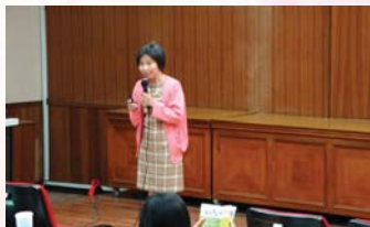
弘光科技大學進行聯合徵才