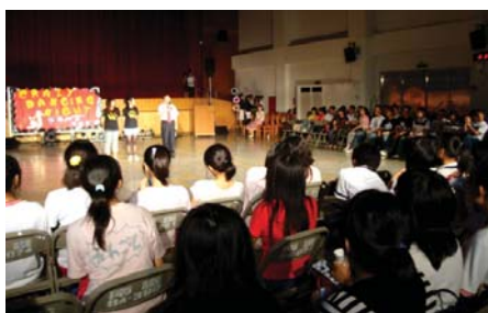
98.5.26國標社舉辦成發會－Crazy Dancing Night邀請校長致詞