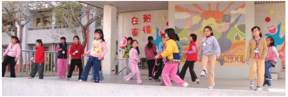
舞所不在體驗營-捷舞練習中