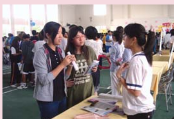
許多學生積極詢問本校資訊