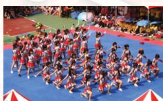
班際啦啦隊比賽之二