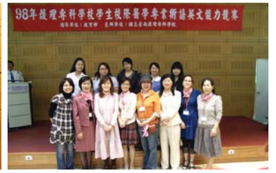
各校老師與獲獎同學合影

二、為建構本科系科本位之課程架構，以提升本科教師之教學品質與學生之核心素養能力，於98年6月18、19日（星期四、五）辦理「提昇系科本位教學品質與核心素養工作坊」，本校護理科與通識教育中心所有教師皆熱情參與，使活動圓滿完成。