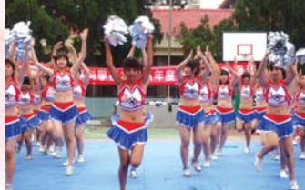
校慶啦啦隊比賽優勝班級表演之一