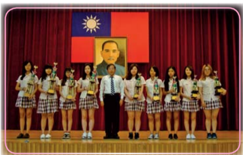
▲全校性集會時校長親臨主持，並頒獎表揚績優學生