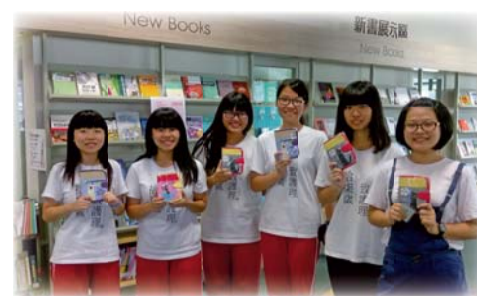
▲105年5月「智財權有獎徵答」活動