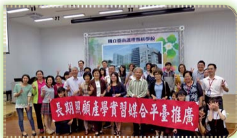
▲ 「長期照顧產學(實習)媒合平臺推廣教育活動」

四、6月7日為五專第一屆同學辦理授徽典禮，由許副校長主持並由本科專任教師授予實習學生逐夢徽章，為自己築夢，為長者圓夢，正式加入照顧長者的行列。