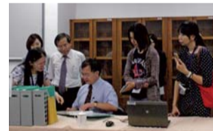
▲ 檔案管理規劃與培訓