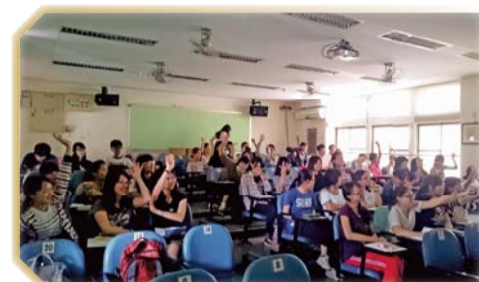
▲學生參與議題並表示自我看法情形