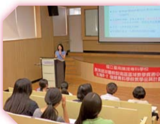
▲校園CSEPT測驗考前說明會