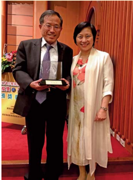
▲ 檔案管理局林局長秋燕恭賀本校榮獲金檔獎

國家發展委員會檔案管理局實地評獎小組於105年7月13日蒞校進行實地評獎，本校檔案管理各項業務，不但獲得評獎委員之高度讚賞外，「檔案管理規劃與培訓」、「檔案鑑定與清理」、「檔案應用」等3項成績，榮獲「特優」；其中：「檔案管理規劃與培訓」榮獲「特優」第1名殊榮，本校順利獲