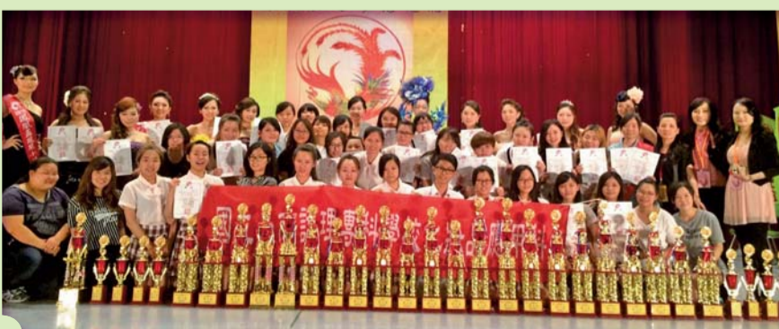
▲ 鳳凰盃時尚造型競賽獲獎師生共同合影