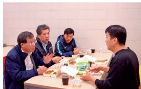
▲陳校長(左一)、江主任(左二)、吳主任教官(左三)與餐廳經營人(右一)試吃，並對餐廳軟硬體設施提出改善要項