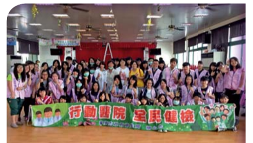
▲衛生保健服務社團本學期支援中西區、安平區、北區行動醫院