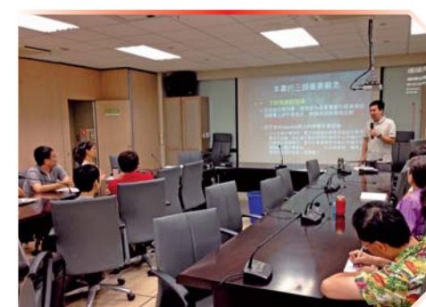
▲ 同仁認真聆聽講師分享