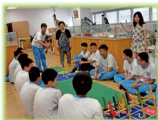
▲指導國中學生親身體驗高齡者在生活上的不便與困境 (老人服務事業科)