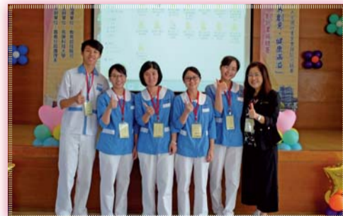
▲ 2016「跨界創意·健康滿溢」創新實務競賽榮獲佳作成績