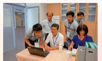
▲ 文書與檔案作業資訊化

終如一，堅持做對的事、把事情做對，終於讓本校檔案管理之績效開花結果，並獲得「金檔獎」之至高榮耀。讓「南護」品牌就像是一顆精雕細琢的鑽石閃亮發光，令人驚豔。此次榮獲金檔獎，是對臺南護專精緻化、優質化管理的