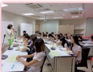
▲第四次「提升全校學生英語能力」會議