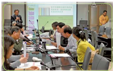
▲青少年網路沉迷行為的成因與對策研討會

三、導師輔導知能研習：本學期結合特色主題計畫，於105年2月18日完成四場次「性別平等」「網路沉迷」及「生命教育」相關議題之導師知能研習，獲得導師熱烈參與，計136人次參加，活動滿意程度達75%~96%。