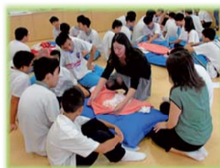
▲指導如何替新生兒包尿布及更換衣服 (護理科)

104學年度共舉辦12場國中師生與家長技職教育宣導、18場次護理類與家政群之體驗學習活動，合計4,503名之師生與家長參加，反應熱烈。