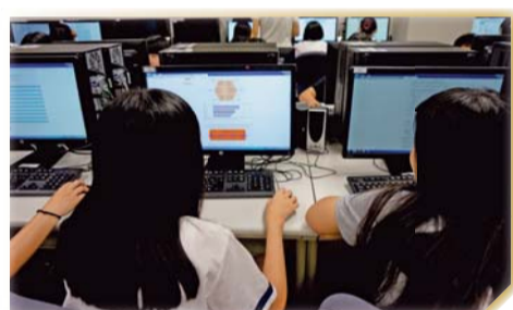
▲學生於施測後閱讀測驗結果藉以了解個人職涯方向