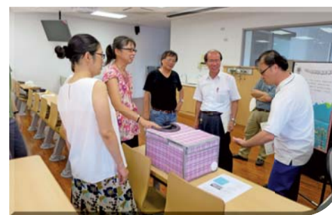
▲2016年科學創意競賽—討論參賽作品實用性的表現