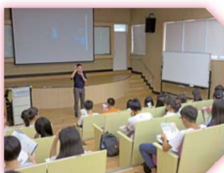
▲多益 (TOEIC) 測驗說明會