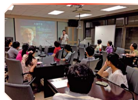
▲ 同仁踴躍參加專書導讀活動

104年9月至105年1月辦理教職員工教師健康促進社團群組、文學讀書會導讀、「採購教育及廉政倫理」及「身心障礙者權利」訓練、「Google 教育雲端服務及其在教學與校務行政上之應用」研習、南護建築檔案展及主管人員個資保護宣導等多項活動，教職員工均踴躍參加。