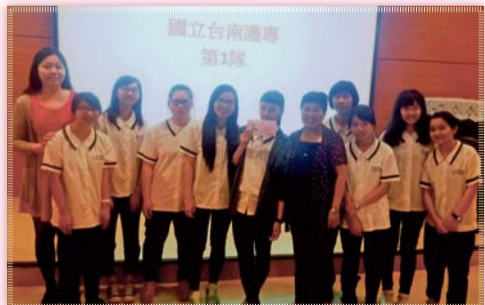
▲ 2016「跨界創意·健康滿溢」創新實務競賽師生合影