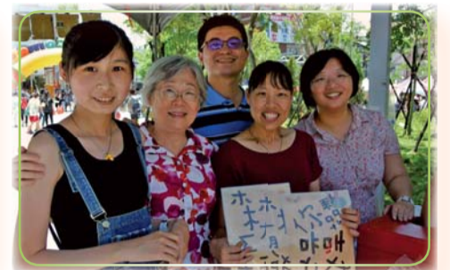
▲資源教室特教宣導活動-有愛無礙特教探索體驗