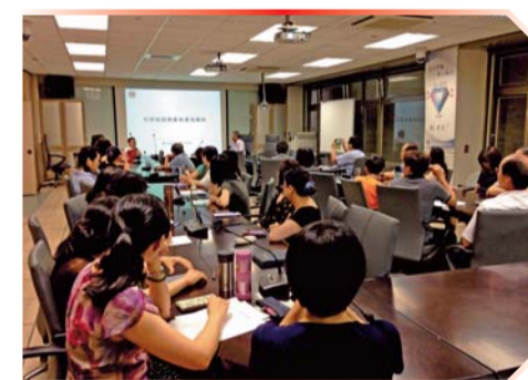
▲ 同仁積極參與並認真聆聽內部控制講習活動