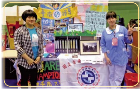
▲105年全國大專校院學生社團評選暨觀摩活動—護科會社長(左)、社員(右)與攤位合影