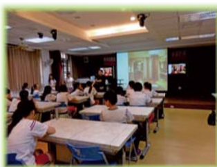
▲指導國中學生體驗舒壓按摩 (化妝品應用科)