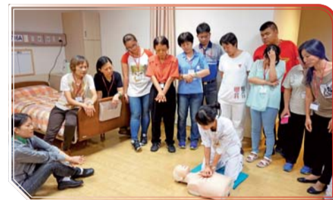
▲ 照顧服務員術科教學