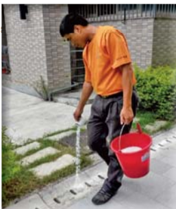
▶ 水溝投藥預防登革熱