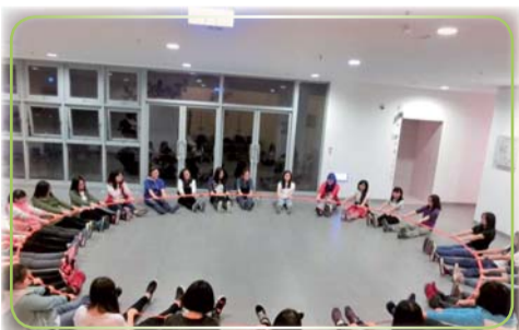
▲當我們同在一起~同理心訓練活動