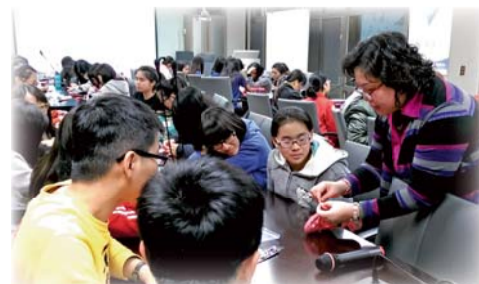
▲105年3月「愛學習·學習愛」活動

圖書館為培養學生尊重生命，關懷弱勢，珍惜環境資源，及尊重智慧財產權的觀念，舉辦主題閱讀、智財權有獎徵答及二手書刊贈送等活動，營造書香校園。