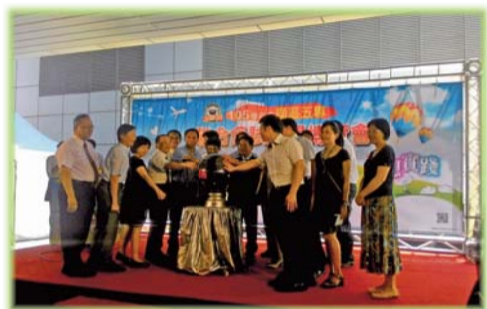
▲組長參加南區五專博覽會開幕式

三、105學年技職校院聯合招生博覽會分別於台北及高雄盛大舉行，透過各科的體驗活動使準新生及社會大眾更了解本校的文化及特色。