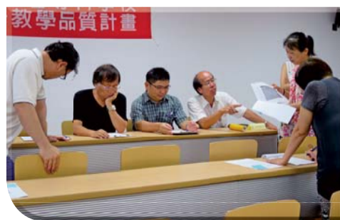
▲2016年科學創意競賽—討論參賽作品獨特與創意的表現