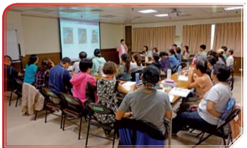
▲ 照顧服務員上課實況

105年1月至6月本組開設社工師學分班第8期(5班)、社工師輔考班1班、ETTC創傷急診訓練研習班2班、ACLS高級心臟救命術2班、美容丙級輔考班1班、美容乙級輔考班2班、照顧服務員訓練班2班等各項課程共15班，各項課程報名踴躍頗受好評，護理類型研習課程通過率達99%，照顧服務職類學員取得結訓證書比例達100%，美容證照考試平均通過率達90%。