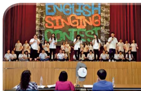
▲英語歌唱比賽活動花絮一