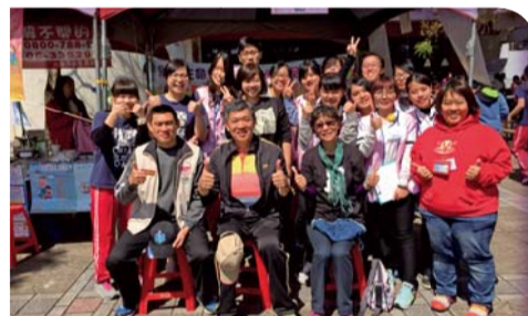
▲保健服務社社員及北區衛生所支援運動會醫護站