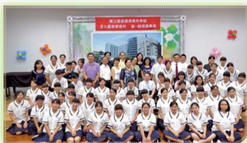
▲ 五專二年級第一屆校外實習之授徽典禮，禮成師生合影

五、為培育健康產業優秀人才、提升就業競爭力，本學期共與6間廠商簽訂策略聯盟合作，相互提供教學、研究、研習及實習場地設施。