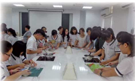
▲105年7月「環保愛地球 送愛到肯亞」