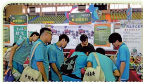
▲ 崑山科技大學進行技職博覽會設展招生宣導

四、6月7日為五專第一屆同學辦理授徽典禮，由許副校長主持並由本科專任教師授予實習學生逐夢徽章，為自己築夢，為長者圓夢，正式加入照顧長者的行列。