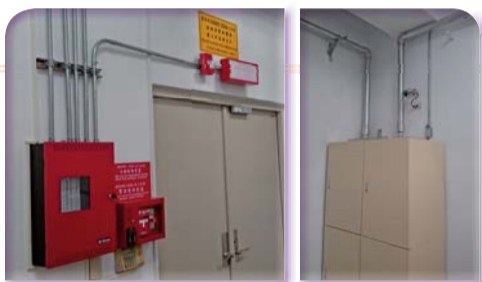
▲ 檔案室增設「自動滅火系統」