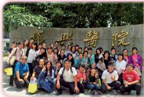
▲ 5+2專班學生於振興醫院參訪後合影