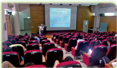
▲ 「橘色科技，無所不在-青銀共創未來」專題演講

三、為培育符合台灣高齡化社會趨勢所需之長期照顧產業人才，特與國立台北健康大學共同辦理「長期照顧產學(實習)媒合平臺推廣教育活動」，推動學校教育與職場核心能力相互結合，並深化產學合作。