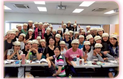
▲ 基本救命術 (BLS) 訓練活動剪影 II