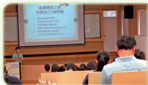
▲ 「我的未來不是夢」專題演講

二、為使學生了解橘色科技及其內涵並應用於長期照顧，辦理「橘色科技，無所不在-青銀共創未來」專題演講，學習將資訊科技應用於銀髮健康照顧行動，提供最佳的整合運作方式。