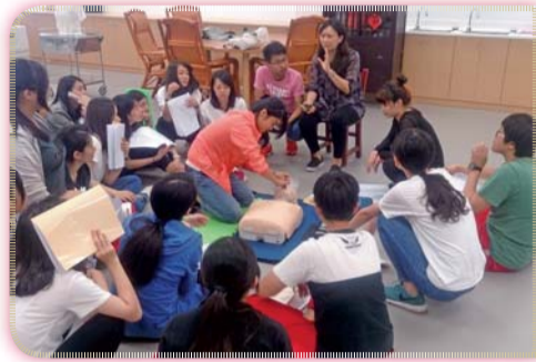
▲ 基本救命術 (BLS) 訓練活動剪影 I