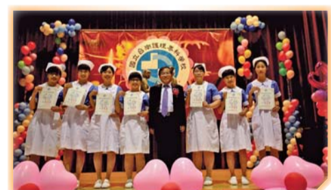
▲ 校長與護理百合天使合影