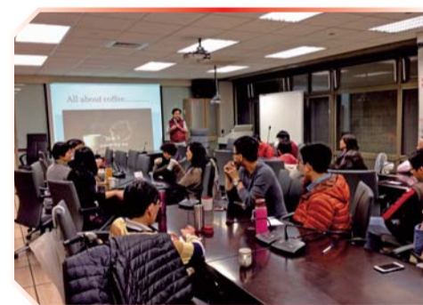
▲ 教職員工踴躍參加「咖啡知多少？」研習活動

105年6月22日辦理本校内部控制講習活動，邀請國立成功大學主計室楊明宗主任主講「内部控制與審核溝通機制」，並為共享學習資源，邀請鄰近學校人員共同參與，活動圓滿完成。