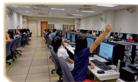
▲施測前本處講解該平台操作方式