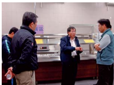
▲校長(中)針對餐廳動線提供建議