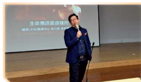
▲ 學生實習個案討論會中學辦輔導講座