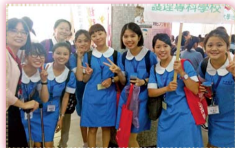
▲ 2016第七屆全國技專校院護理實務能力競賽師生合影