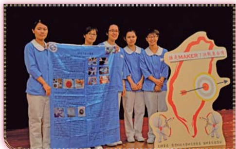
▲ 誰是MAKER? 決戰東台灣競賽榮獲第三名佳績