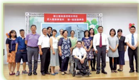
▲ 五專二年級第一屆校外實習之授徽典禮，全體參與師長合影