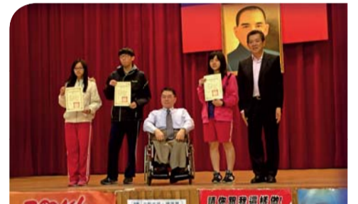
▲頒發104學年度第一學期整潔競賽班級獎狀及獎金