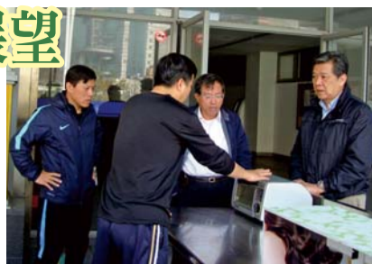
▲陳校長、江學務主任、吳主任教官與餐廳經營人共同視察餐廳設備

「堅持需要毅力」、「管理需要科學」。「試營運整備」階段自103年9月廠商得標至104年元月餐廳取得使用執照止。主要經營管理目標在「設備檢測及運轉妥善」及「營運動線規畫及調整」等兩項，餐廳設備雖符合國家規範，然未實際運作，無法得知設備妥善率及操作安全性，經廠商多次測試及試載運轉，改善保固期限內良率欠佳設備，適時維護機具妥善；其次餐廳設計受限為地下避難空間，用餐動線規畫須掌握教職員工生用餐作息及慣性，避免人潮擁擠造成不便及危險。經討論後已調整「人潮分流」、「增設便利取餐區」等5項改善措施。此期間並實施「學生膳食意見蒐集暨供餐規畫」，除參考友校及鄰近自助餐價位與菜色外，並實施本校「膳食意見調查」、「試吃及意見回饋活動」，以相對經濟實惠價格，做到早餐訂餐（10-45元）、午餐訂餐（55元提供飲料），提供多元選擇。在「營運管理階段」區分：「住宿生早餐服務」、「便利取餐」、「全校午餐供餐」及「膳食會議暨問卷調查與改善」等四項。說明如下：「住宿生訂餐服務」採每週（平日）常態性訂餐方式，由各樓長或工讀生協助調查各樓層餐