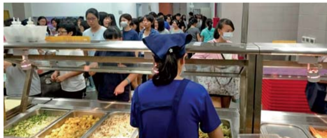
▲色香味俱全菜色豐富的點餐櫃