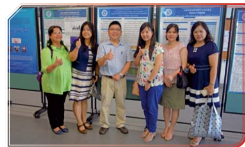
▲ 校內師生共同蒞臨觀摩合照