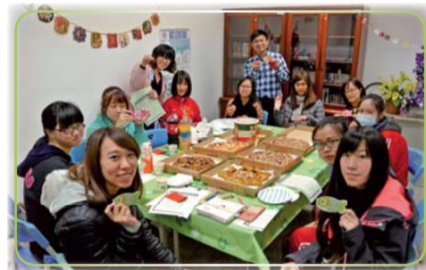
▲資源教室輔導活動-期初座談會