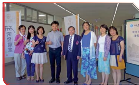
▲ 104校內研究計畫海報成果展校長蒞臨參觀