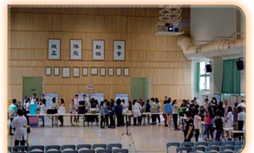
▲ 2016化妝品香氣應用研討會暨全國香水技術競賽實況之二