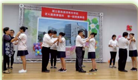
▲ 五專二年級第一屆校外實習之授徽，由專任教師授予同學逐夢徽章