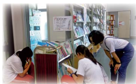
▲105年5月二手書刊贈送活動