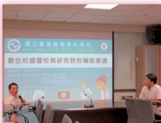
▲聯合樹德科技大學辦理「數位校園暨校務研究跨校輔航會議」