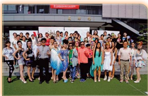
▲ 2016夢想遊戲造型競賽後合影