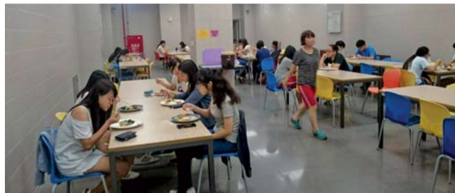
▲舒適寬敞的用餐環境

室訂餐情形，當日現場備料、烹煮及分裝，於每日上午0650時前送抵宿舍，方便學生0730時前離宿拿取，使學生免於外出購買之困擾。另「便利取餐」為提供通勤教職員工生便利、快速取餐方式，規畫於晨晞樓階梯前設置便利取餐區，提供現場烹煮各類餐食選購，能有效擴大服務對象。「全校午餐供餐」，開放為全校教職員工生訂（供）餐服務，學生可透過班級膳食幹部協助訂餐。各行政單位可依活動需求不同，提供高單價客製餐盒。其次在「膳食會議暨問卷調查與改善」上，定期召開膳食委員會會議，針對「人潮分流」、「價格區隔」、「節能環保」等意見，研擬對應措施。