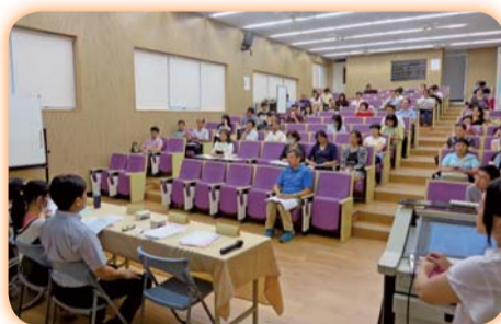
▲兼任教師座談會參與教師專注聆聽相關資訊