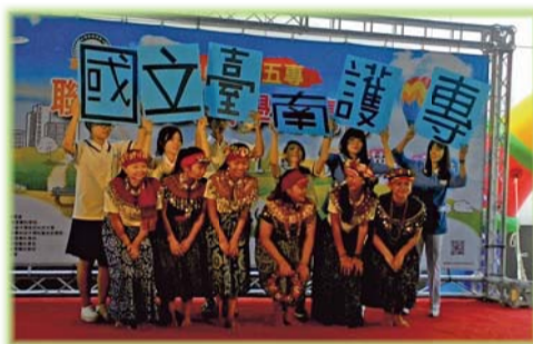
▲五專博覽會表演充滿活力與原住民文化特色