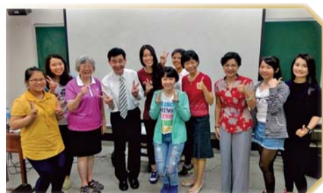
▲學生於活動結束後與講師討論並留下合影