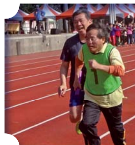
▲校長參與大隊接力競賽