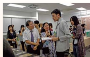
▲ 檔案保管與庫房設施