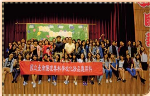
▲ 溫馨送舊—我們重返16歲活動後合影

四、105年03月至05月期間，為應屆畢業生班級安排一系列企業徵才及就業職場體驗活動共7場次，升學講座共4場次。