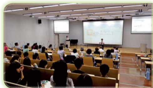
▲ 「長期照顧產學(實習)媒合平臺推廣教育活動」

三、為培育符合台灣高齡化社會趨勢所需之長期照顧產業人才，特與國立台北健康大學共同辦理「長期照顧產學(實習)媒合平臺推廣教育活動」，推動學校教育與職場核心能力相互結合，並深化產學合作。