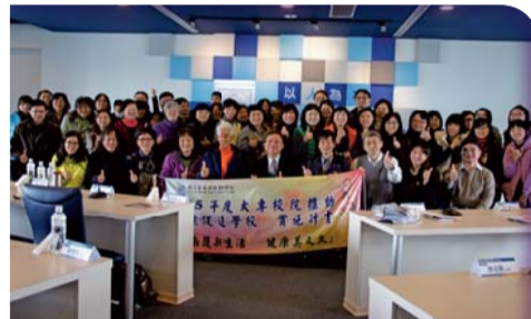
▲教職員工及學生多元典範學校參訪