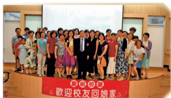
▲校長到場關心並與主講者、在校生、校友們合影