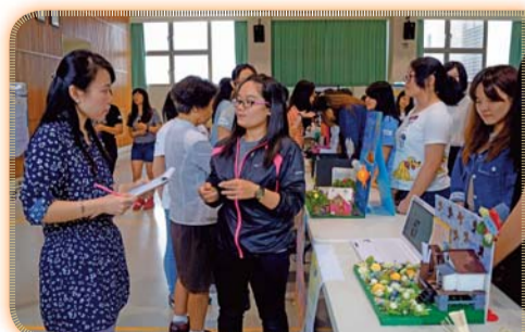
▲ 2016化妝品香氣應用研討會暨全國香水技術競賽實況之一