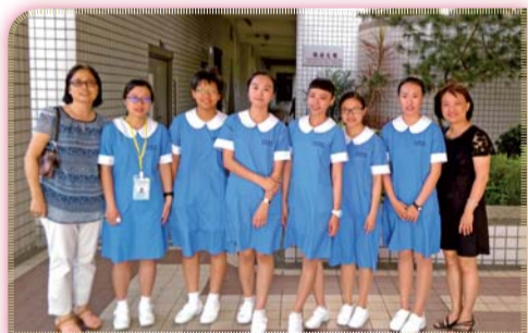
▲ 第46屆全國技能競賽南區分區技能競賽全數獲獎的好成績