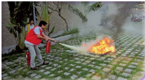
▲ 消防演習操作實況