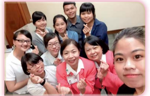
▲ 五年級學生與新光醫院護理部主管合影