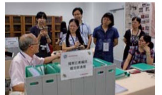
▲ 檔案立案編目、鑑定與清理