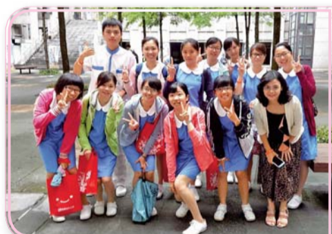
▲林口長庚護理實務能力競賽師生合影