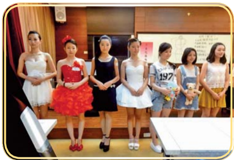
▲全國時尚創意技藝競賽會場

八、配合教育部執行補助e-beauty化妝品應用科教學品質計畫，於5/16辦理「104年全國時尚創意技藝競賽」活動，本校學生表現優異榮獲第一名2位、第二名2位、第三名4位、優選9位、佳作5位及入選6位，共26個獎項。