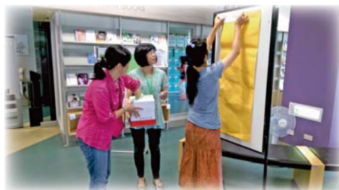
▲104年6月「智財權有獎徵答」活動