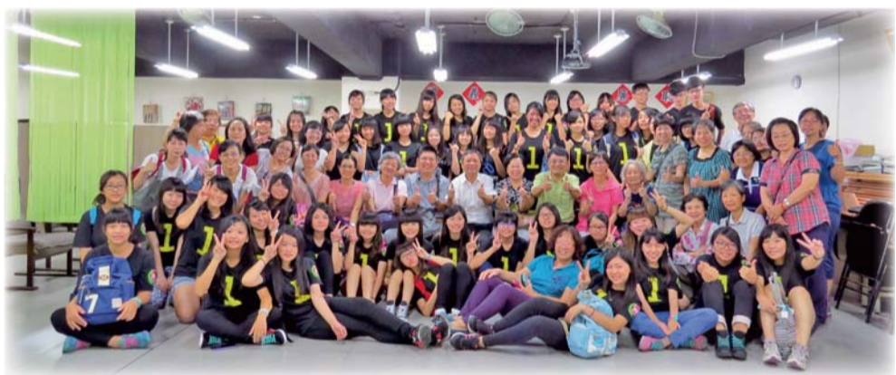
▲五專學生及老師至嘉義市居家服務中心參訪

二、辦理創意教學之「異業結合、老人服務：銀髮新生活體驗」活動，帶領學生體驗銀髮族生活的食衣住行，讓學生認識與體驗雲端科技於銀髮族之運用。