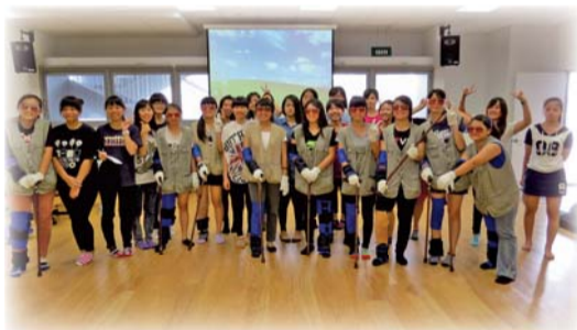
▲老人服務：銀髮新生活體驗活動，學生穿著高齡者模擬體驗裝體驗長者生活

三、辦理三場次異業結合、老人服務的推廣專題演講；主題有「銀髮理財面面觀」介紹銀髮理財產業，並討論如何將理財產業與銀髮服務產業結合；「老人休閒民宿社區網路之建構」、及「老人休閒事業網路行銷之發展」介紹如何運用網路，來推廣銀髮旅遊業務。