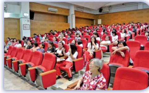
▲學生週會專題演講—在虛擬與現實中悠遊