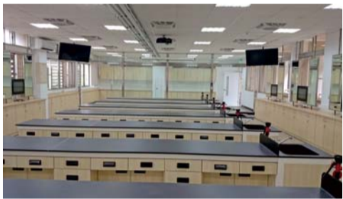
▲寇思樓—4F美容美髮暨美甲多功能教室