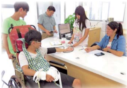
▲老人服務：銀髮新生活體驗活動，幫穿著高齡者模擬體驗裝的學生量測血壓

二、辦理創意教學之「異業結合、老人服務：銀髮新生活體驗」活動，帶領學生體驗銀髮族生活的食衣住行，讓學生認識與體驗雲端科技於銀髮族之運用。