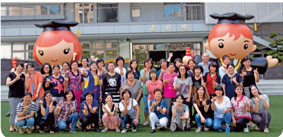
▲托育人員訓練班大合照