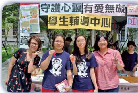
▲校慶活動—學輔中心業務宣導