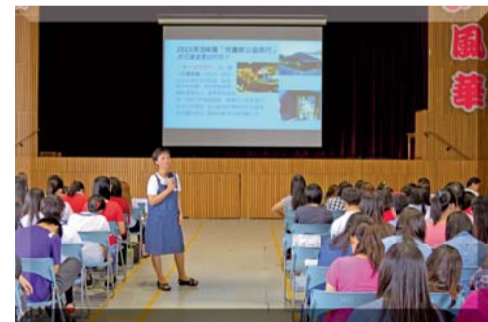
▲基礎服務學習講座—志工發展趨勢