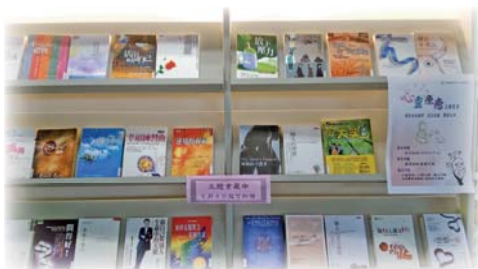
▲104年5月「心靈療癒」主題書展