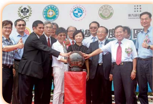
▲校長參加南區五專博覽會開幕式

(三) 104學年技職校院聯合招生博覽會分別於台北及高雄盛大舉行，透過各科的體驗活動使準新生及社會大眾更了解本校的文化及特色。