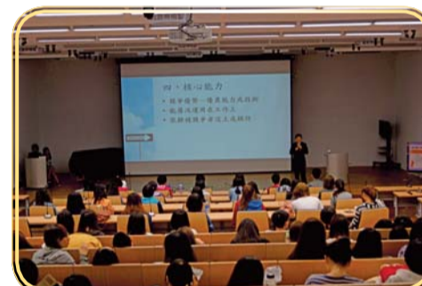
▲專題演講—求職好運到愈做愈好運

二、為協助學生及早做好心理調適，順利進入理想職場就業。4-5月，為畢業生班級安排一系列企業徵才及就業職場體驗活動(如附表)。