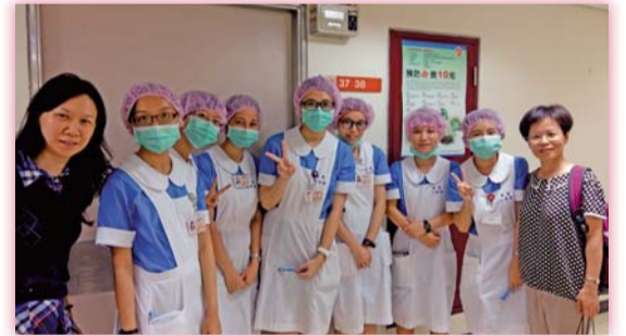
▲104年6月於高榮感控病房學生關懷訪視