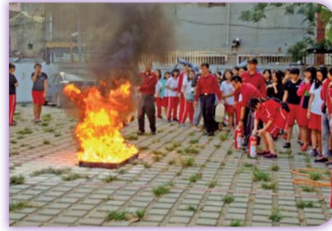
▲學生宿舍防災逃生演練活動