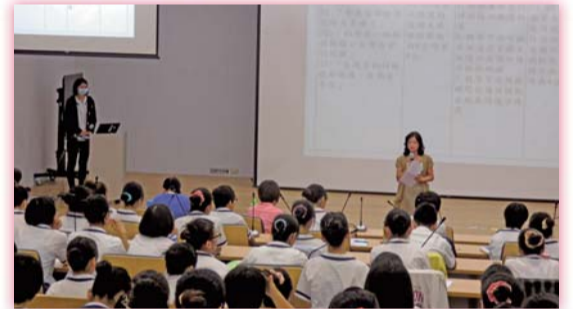
▲104年4月實習生個案研討會