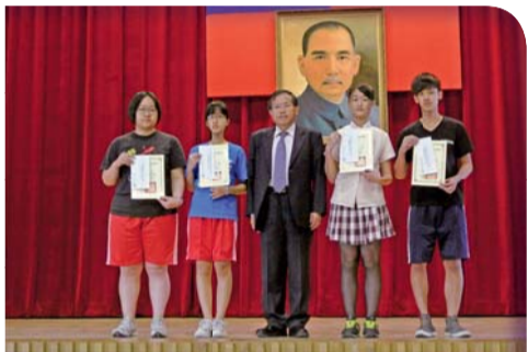
▲集會時校長頒發校園整潔競賽獎狀