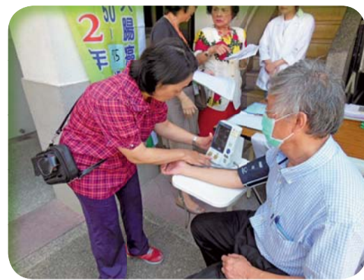
▲學生幫社區民眾測量血壓

五、為增加學生服務社區民眾之實務能力，辦理2場次社區民眾健康服務與宣導工作，主題為「常見的腎臟疾患自我照顧之健康檢測」。