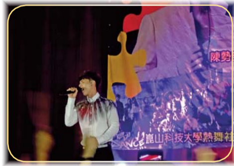
▲「拼·青春」畢業晚會—藝人陳勢安獻唱