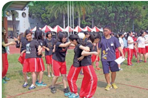
▲趣味競賽比賽實況