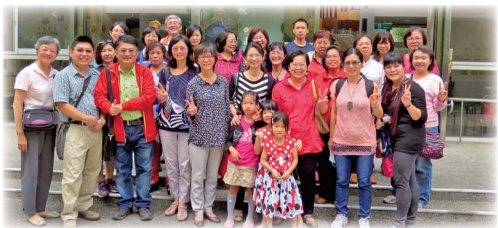
▲二專學生及老師至嘉義市長青園參訪

一、為提升教師們及學生之跨專業、多元化銀髮服務教學能力並將所學習之知識運用於教學中，本學期共辦理兩場次「銀髮服務產業參訪—嘉義市長青園」及「銀髮服務產業參訪—嘉義市居家服務中心」參訪，以落實實務與理論之結合。