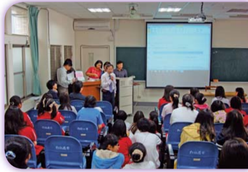
▲學生宿舍座談校長蒞臨與會，協助相關事務處理