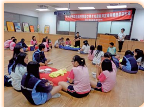
▲指導如何替新生兒包尿布及更換衣服(護理科)

103學年度共舉辦17場國中師生與家長技職教育宣導、17場次護理類與家政群之體驗學習活動，合計8,579名之師生與家長參加，反映熱烈。透過宣導與體驗活動，增進國中學校與技職學校之合作與互動，協助師生瞭解技職教育之特性、升學管道與多元發展進路。使學生能依性向、興趣及能力達到「選技職、好好讀、有前途」之技職教育發展特色。