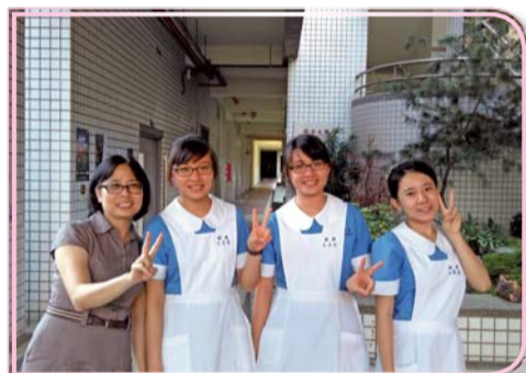
▲全國技能競賽師生合影