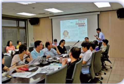
▲導師輔導知能研習—指尖的哀愁~網路求救警訊與自殺防治