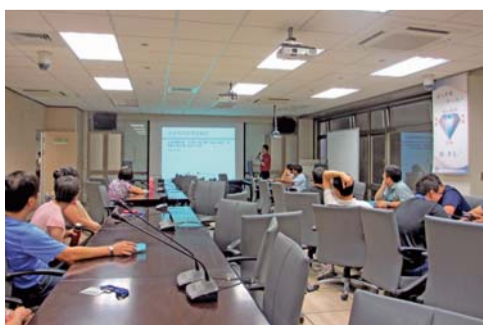
▲防火防震暨自衛編組訓練