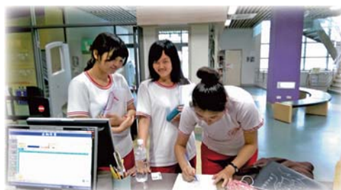
▲104年4月舊愛新歡~二手書刊贈送活動