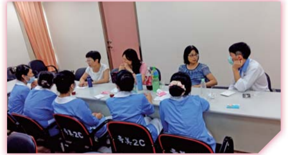
▲104年7月實習生輔導訪視