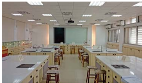
▲寇思樓—5F中草藥養生專業教室