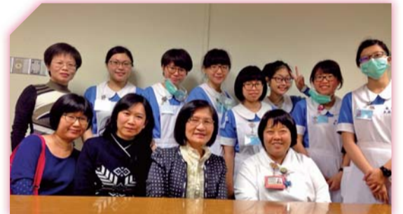
▲104年2月於成大醫院特殊生實習協調會