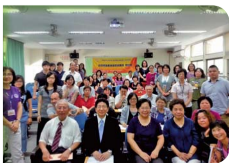
▲「台日照護產業經營與實務研討會」師生與日本曾根憲昭博士合影