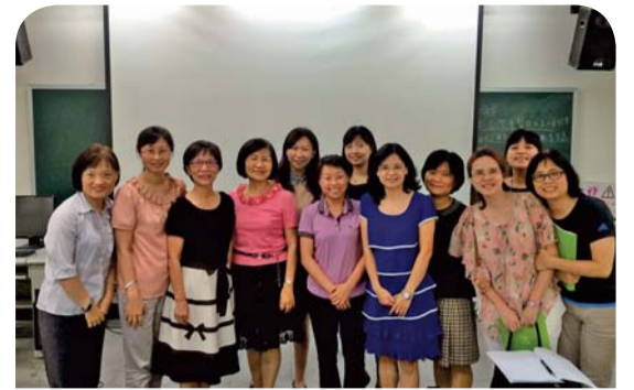
▲2015南護健康照護研討會護理類大合照