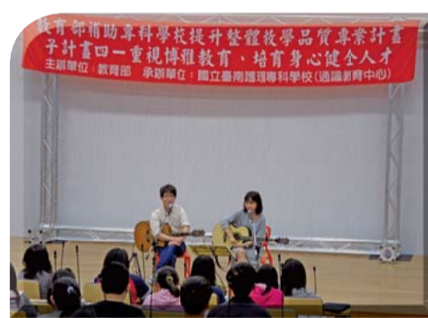
▲博雅講座—LIVE & LIFE 阿樂音樂 文創講座