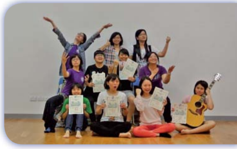
▲學生輔導活動—假日工作坊「同理心“藝”起PLAY」