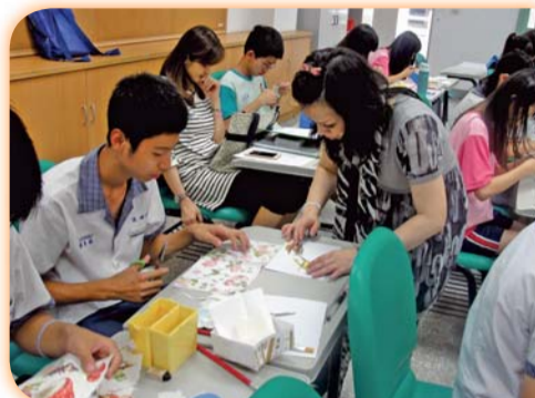
▲指導國中生體驗彩繪紙圖(化妝品應用科)