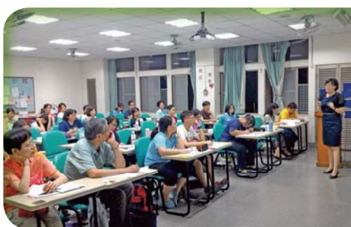
▲異業結合老人服務：「銀髮理財面面觀」老師授課情形

三、辦理三場次異業結合、老人服務的推廣專題演講；主題有「銀髮理財面面觀」介紹銀髮理財產業，並討論如何將理財產業與銀髮服務產業結合；「老人休閒民宿社區網路之建構」、及「老人休閒事業網路行銷之發展」介紹如何運用網路，來推廣銀髮旅遊業務。