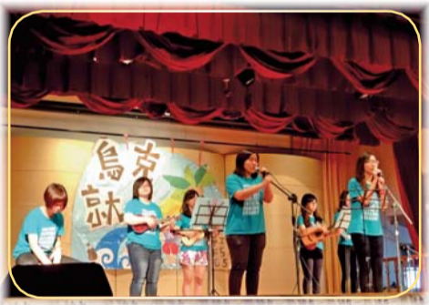
▲「烏克蘭就要」三校聯合成果發表會—同學賣力演出