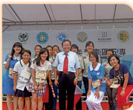
▲校長帶隊參加五專博覽會表演