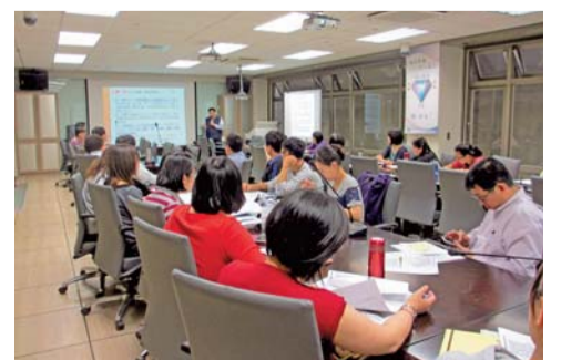
▲「政府採購法」教育訓練