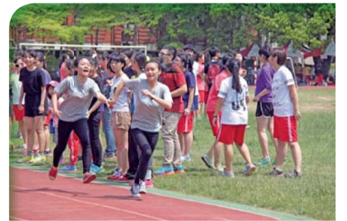
▲大隊接力比賽實況