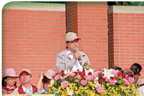
▲運動會開幕典禮陳校長致詞