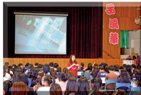
▲基礎服務學習講座—志願服務的內涵