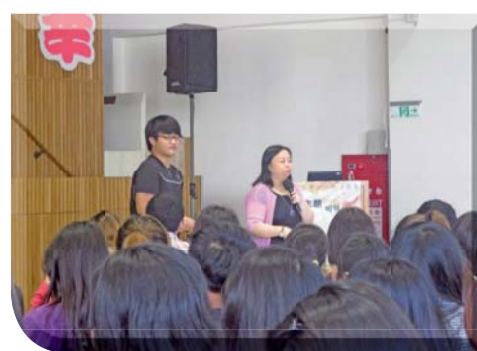
▲基礎服務學習講座—志願服務倫理