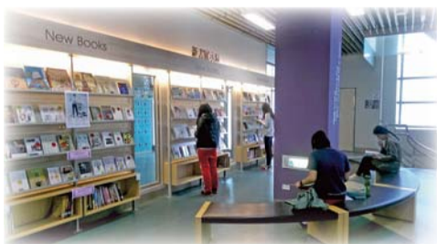
▲104年3月「開卷好書獎」全國聯展活動

圖書館為養成學生廣泛閱讀習慣，培養人文關懷，尊重智慧財產權的觀念，舉辦主題書展、智財權有獎徵答及二手書刊贈送等活動，營造書香校園。