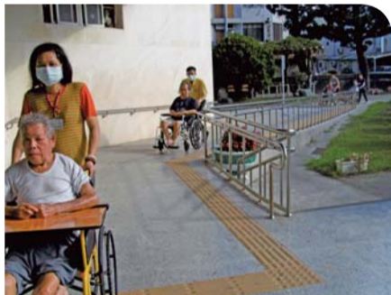
▲照顧服務員訓練班實習實況

1月至6月共開設社工師學分班第4期至第6期(各5班)、社工師輔考班1班、社工師衝刺班1班、領隊導遊輔考班1班、ETTC創傷急診訓練研習班1班、行動裝置課程1班、菁英領袖營1班、ACLS高級心臟救命術2班、美容丙級輔考班2班、美容乙級輔考班1班、照顧服務員訓練班2班、托育人員專業訓練班1班等各項課程共29班，各項課程報名踴躍頗受好評，護理類型研習課程通過率達100%，照顧服務職類學員取得結訓證書比例達99%。