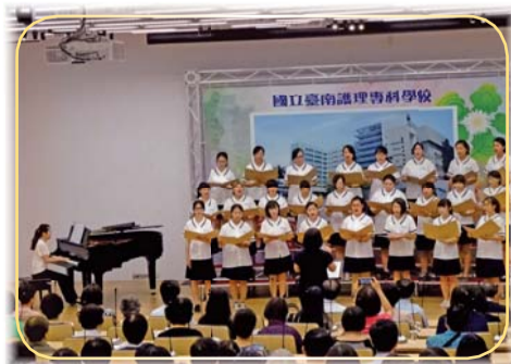
▲「築夢南護 六二飛翔」校慶慶祝大會—合唱團獻唱