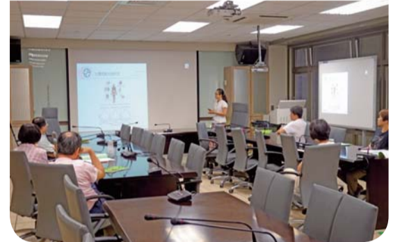
▲2015南護健康照護研討會科學類分享情形