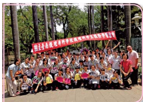
▲三年四班同學服務學習活動後合影

四、5/16、17、30辦理五場次的基本救命術訓練，共計有校外同學215名學員參與訓練，全數學員通過測試，取得基本救命術(BLS)證照。