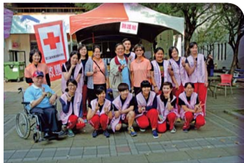
▲許副校長與學務陳主任關懷救護站，並與保健服務師生合影