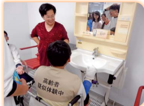
▲指導國中生體驗高齡者的模擬服裝(老人服務事業科)