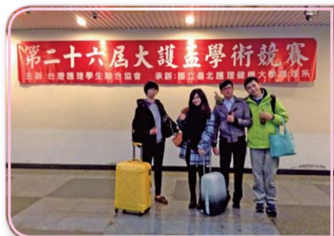
▲大護盃獲獎同學合影