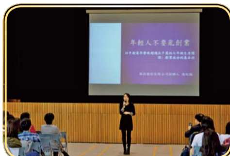
▲專題演講—談創業成功的基本功