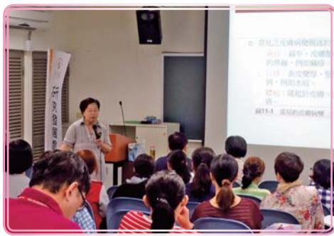
▲ 照顧服務員上課實況