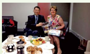
▲ 拜會格里菲斯大學附設醫院與老人照護學系資深教授 Bamford-Wade(右)合影