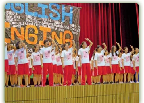
▲ 英語歌唱比賽活動花絮四