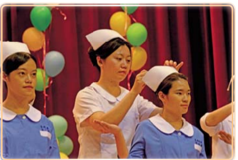
▲ 護理老師們為二百六十名準白衣天使，配戴護師帽及背帶

護理人才的培育是一條艱辛、漫長的過程，希望臨床能營造友善的職場環境，能吸引更多優質的人才加入白衣天使的行列。