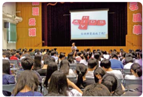
▲「愛之秘密花園，健康久遠」系列活動-認識愛滋病防治講座