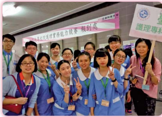
▲ 2017第八屆全國技專校院護理實務能力競賽參賽師生合影