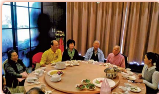
▲退休人員共同聚餐分享生活點滴