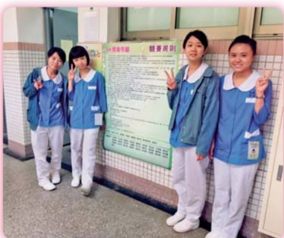
▲ 第47屆全國技能競賽南區分區技能競賽參賽同學