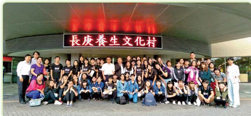
▲參訪長庚養生文化村