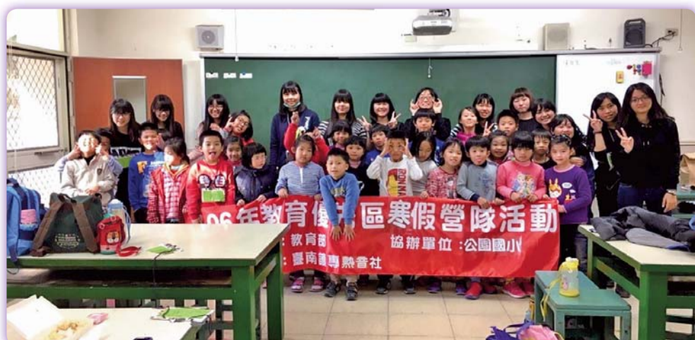
▲熱音社：歡樂冬令營