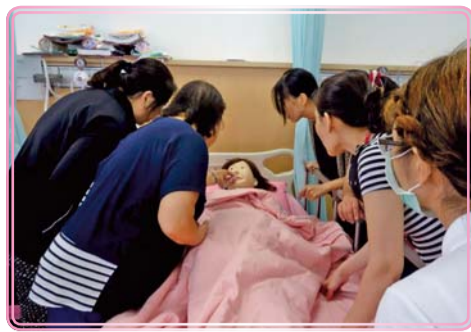
▲ 照顧服務員術科教學