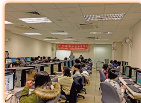
▲ 學習歷程檔案競賽說明會現場