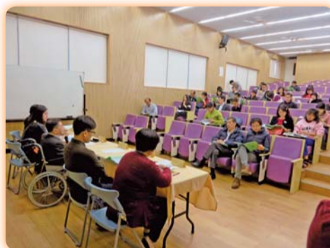
▲ 各單位行政主管及兼任教師熱情參與兼任教師座談會

現場指導，並感謝各單位行政主管及兼任教師熱情參與；(2)教具使用暨學生加退選說明會-106.02.21；(3)受理加退選期間-106.02.14-105.03.03；(4)學習歷程檔案競賽說明會-106.02.24；(5)學習歷程資訊系統暨課程地圖教育訓練-106.03.03；(6)學習歷程檔案暨課程地圖演講-106.03.10；(7)學習歷程檔案(e-portfolio)競賽活動-106.03.03-106.03.28；(8)學科能力競試於106.02.24舉行，科目範圍及考試時間表已公告於本校網站首頁，書面資料亦發予各班級知悉。