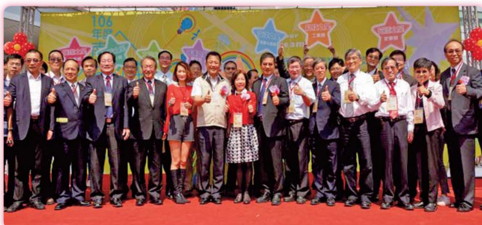
▲ 校長參加南區五專博覽會開幕式

三、106學年技職校院聯合招生博覽會分別於台北及高雄盛大舉行，透過各科的體驗活動使準新生及社會大眾更了解本校的文化及特色。