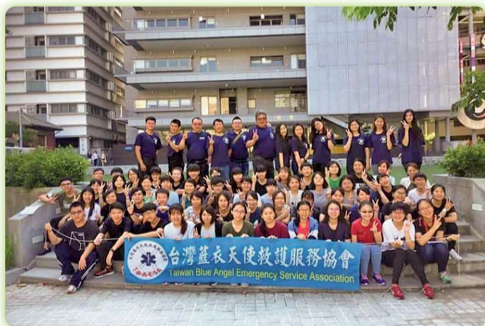
▲初級救護技術員(EMT-1)訓練

培育學生畢業即能就業的能力，學生在校學習期間特別注重三創思維和主動精神的培養，希望學生畢業後不再是扮演求職者的角色，更要成為職業崗位的創造者。藉此，藉由辦理許多活動與國際研討會，例如辦理初級救護技術員(EMT-1)訓練班、