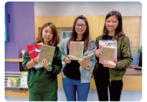
▲ 過關同學開心展示精美獎品