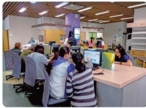
▲ 工作人員指導同學線上使用中文電子圖書

響，紛紛呼朋引伴一起來挑戰。參與的同學除了對活動方式活潑有趣給予高度肯定外，同時表示館內資源原來如此豐富，而電子圖書使用便利，讓學習更為豐富多元了！