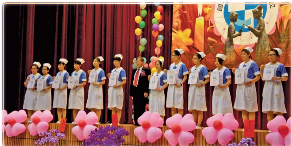
▲ 護理百合天使表揚