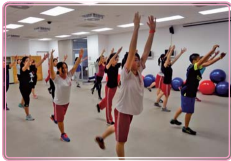
▲ 有氧雕塑肌力養成班上課實況