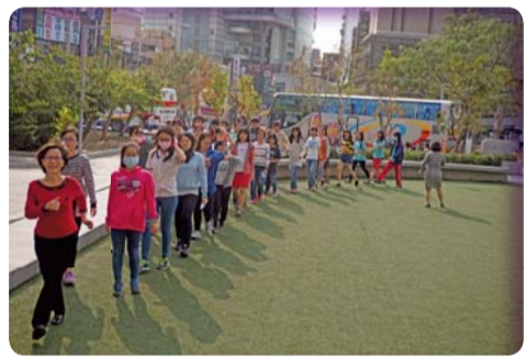
▲「快樂躍動，健康無窮」系列活動-活力主題日校園健走活動

測、拒菸宣誓、菸害防制知能大考驗，以提升無菸校園環境。讓愛之關愛常在，建立正確的愛滋知識，性教育（含愛滋病防治）—「愛之秘密花園，健康久遠」系列活動，辦理班級性教育（含愛滋病防治）影片賞析、邀請性病專家分享愛滋病治療及有獎徵答、配合運動會設攤及校慶闖關活動，教導戴保險套正確觀念。舉辦「護眼潔牙急救護，健康保固」安全教育主題活動推廣校園急救教育；協辦衛生局（所）辦理社區行動醫院，積極提供學生參與校外公共醫療服務機會。感謝財團法人歐巴尼紀念基金會全額補助「急救到偏鄉 愛心傳社區」偏遠醫療服務計畫，讓保健服務社、服科會及學生會同學，赴偏鄉小學教導急救及保健知識，學生將所學貢獻社會，擁有更寬廣的健康服務視野。