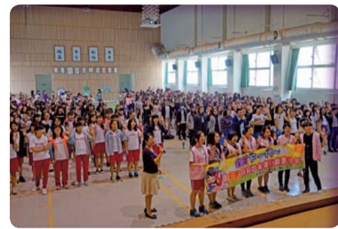
▲「拒絕菸害，健康常在」系列活動-無菸校園拒菸宣誓