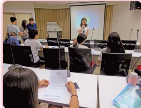
▲105-2學期第二次「提升全校英語能力」會議