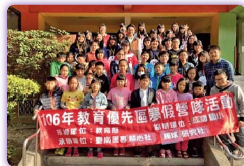
▲耕心社、棒球研究社：辛辛那提