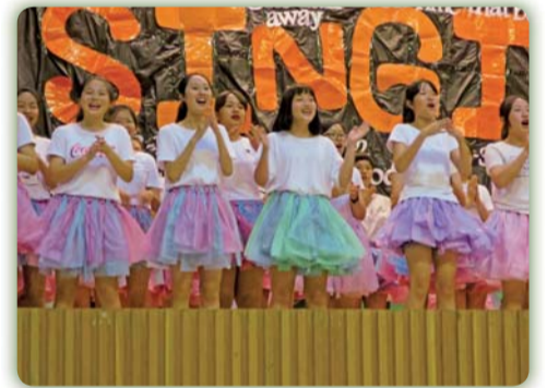
▲ 英語歌唱比賽活動花絮二