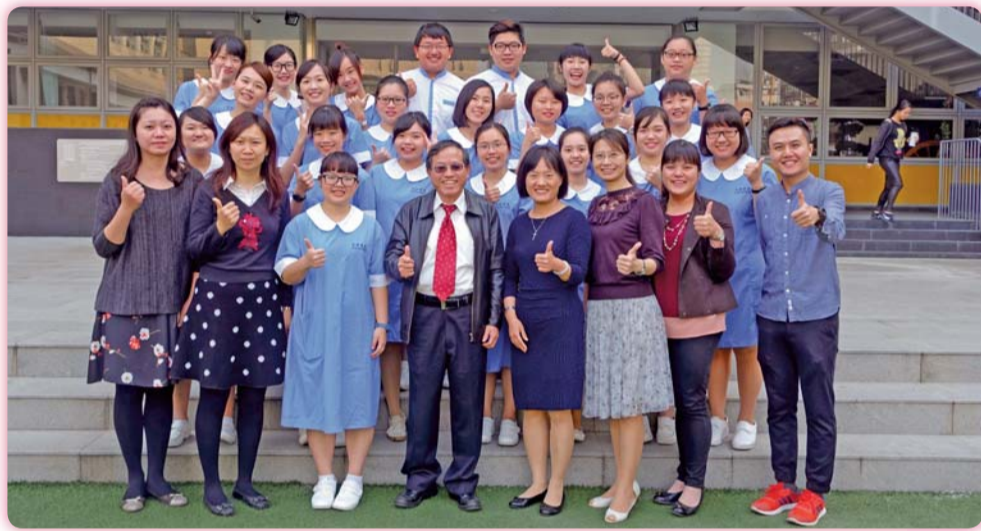
▲ 產學合作專班應屆畢業生與師長合影