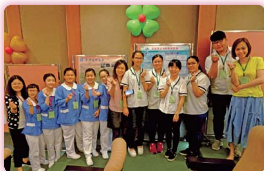
▲ 2017「一起轉動健康與創意」創新實務競賽參賽師生合影