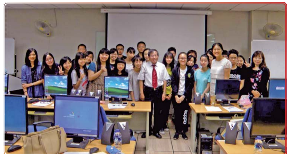
▲ ESL 暑期課程學生與家長行前說明會