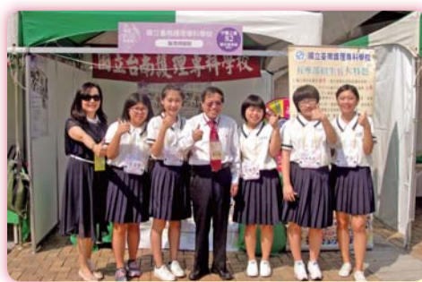
▲ 五專博覽會體驗活動