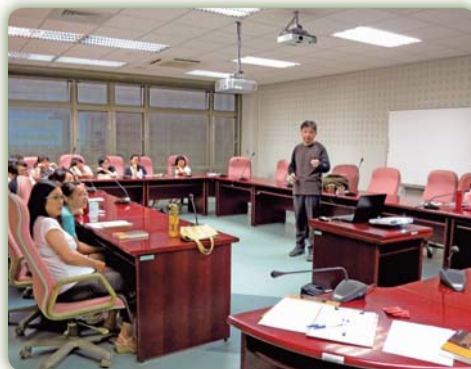
▲ 讀書會活動花絮一

人，藉由舉辦讀書會活動，鼓勵學生多閱讀課外書籍，並在活動中由講師引導學生，增進邏輯思考及寫作能力。