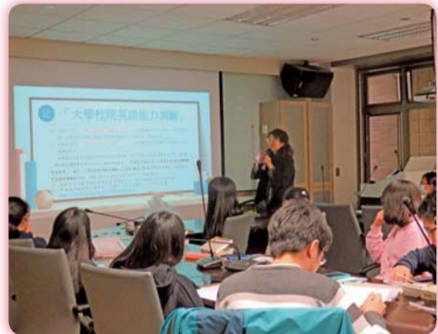
▲105-2學期第一次「提升全校英語能力」會議

時也提升學生自主學習能力，創造雙贏局面。沈教授提供豐富教材內容，分享教學平台使用心得，風趣又不失主軸的演講讓參與講座的教師與同學們，不但認真聽講，會後也踴躍發問達到雙向提升。