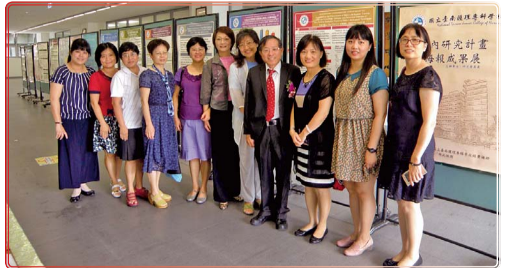
▲ 105校內研究計畫海報成果展校長及校內教師蒞臨參觀