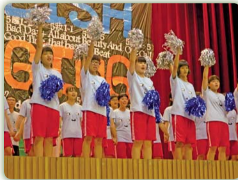
▲ 英語歌唱比賽活動花絮一