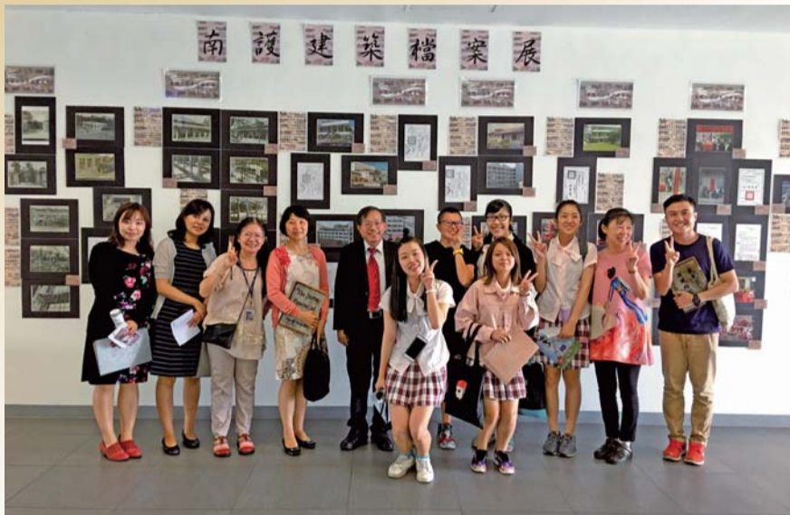
▲ 校長與參觀檔案展的師生合影