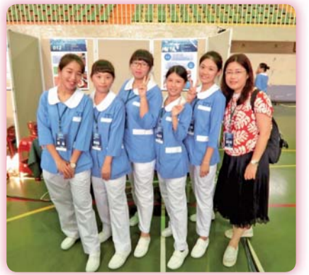
▲ 2017全國工業節能創意實作競賽參賽師生合影