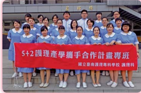
▲ 產學合作專班應屆畢業生合影