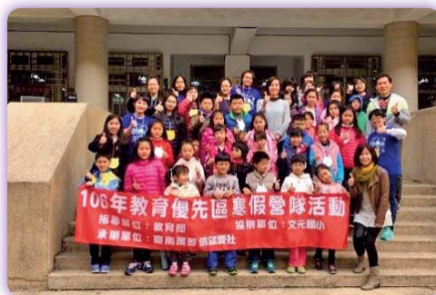
▲信望愛社：動冬腦 憶起來