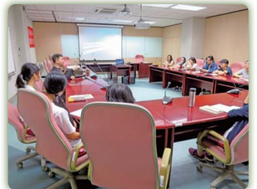
▲ 讀書會活動花絮二