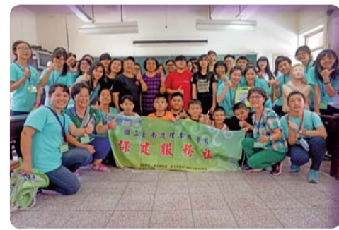
▲「急救到偏鄉 愛心傳社區」偏遠醫療服務計畫圓滿完成