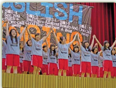
▲ 英語歌唱比賽活動花絮三