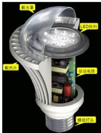
图 1: 典型 LED 灯泡剖视图