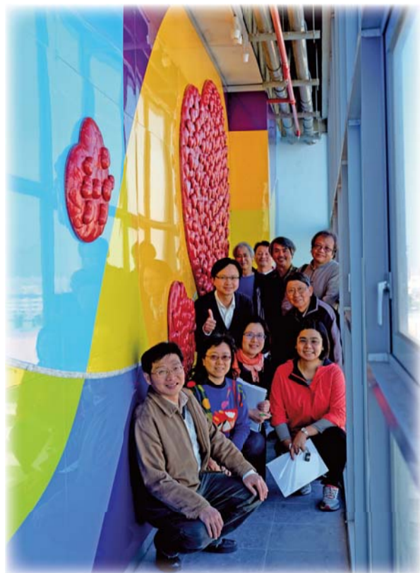
▲辛苦的工作團隊與「放·頌·愛」合影；傳遞溫暖無私之愛