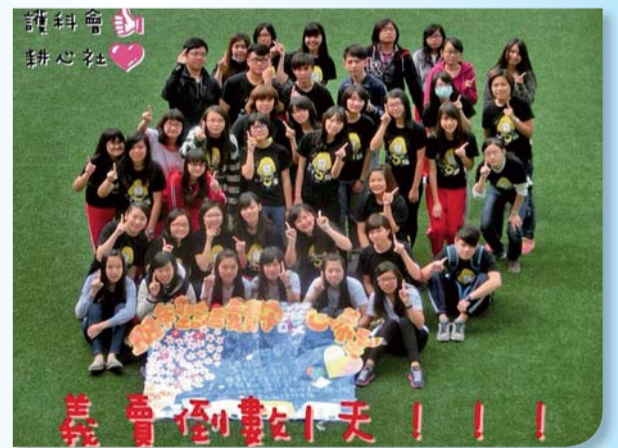
▲「守護心希望」聖誕義賣活動；感謝師生共襄盛舉

護科會本學期舉辦活動計有：1.護理科科服徵選、2.「護理迎呼你贏」新生團康活動、3.洗手比賽、4.跑台比賽、5.與耕心社合辦「守護心希望」聖誕義賣活動、6.與學生會及妝科會合辦「全面啓動—聖誕聯盟」聖誕晚會。活動的進行因全校師生熱情參與，成果豐碩。在此，感謝熱愛科會及服務的夥伴們戮力完成每一場活動，並讓我們獲得社團評鑑第一名的殊榮。護科會衷心期盼更多有滿腔熱血卻無處發揮的同學們，一起加入這個大家庭共同努力！