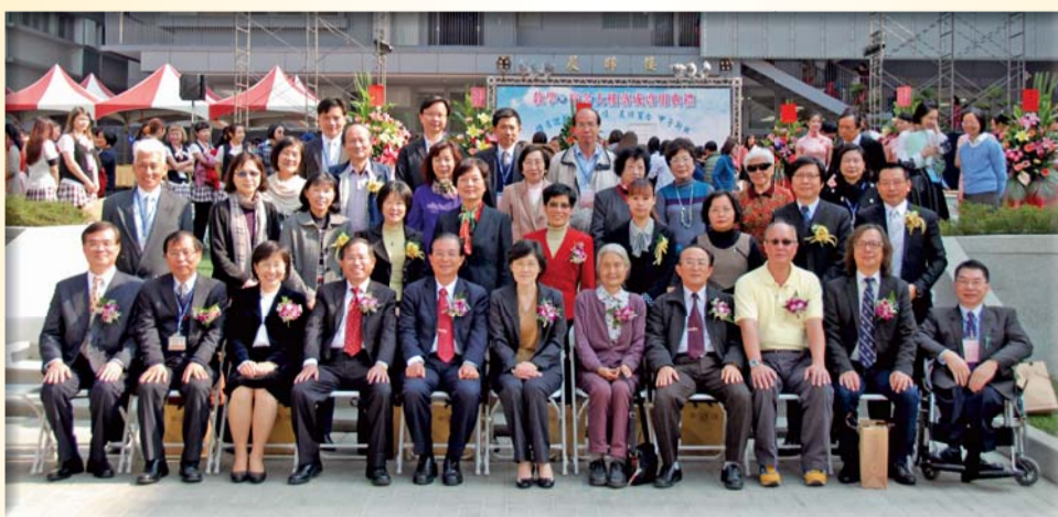
▲落成典禮與會貴賓合照