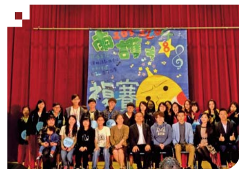
▲第八屆南護之星歌唱比賽圓滿落幕