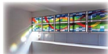
▲陽光透過「生·命·力」彩繪玻璃，灑下無盡的熱誠與希望