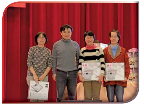
▲104年新春聯歡活動一摸彩