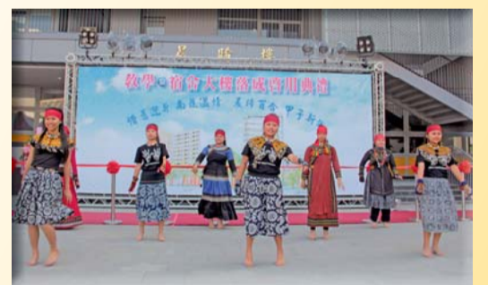
▲原青社表演詮釋優美的原住民文化