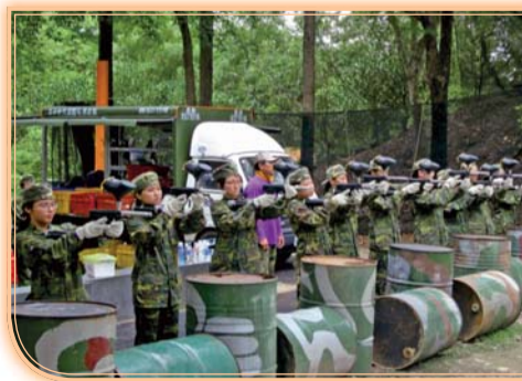
▲漆彈—漆彈槍使用說明