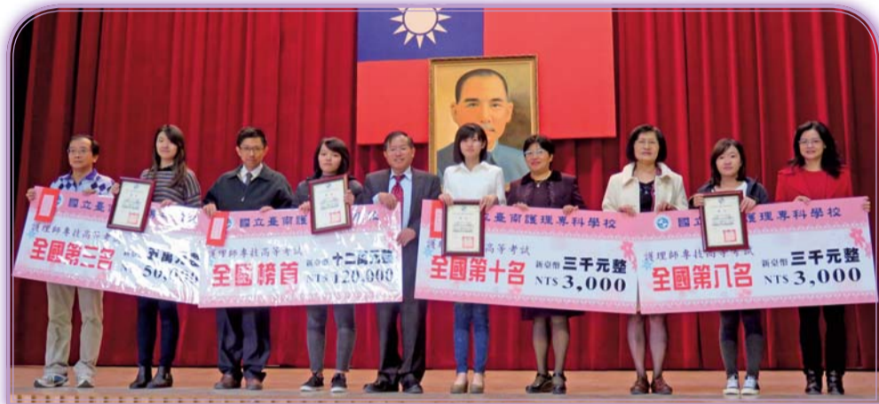
▲103年第二次專技高考護理師類科成績優異校友表揚頒獎