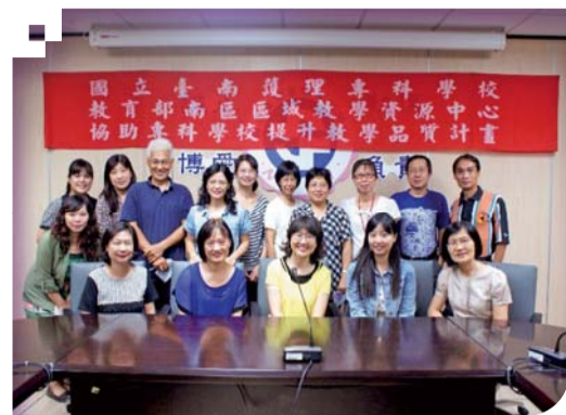
▲績優教學分享講座—全體教師合照