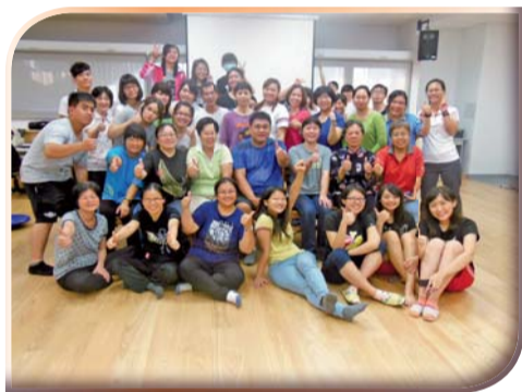
▲「樂齡運動指導員」訓練養成課程一師生合影