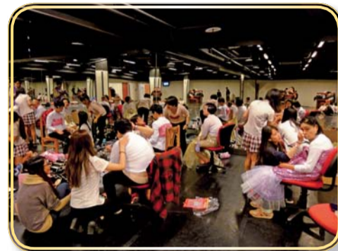
▲瑞復益智中心40週年慶祝晚會彩妝支援