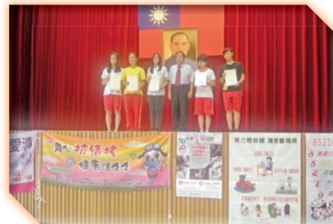
▲校長頒發整潔競賽優勝班級獎狀及獎金