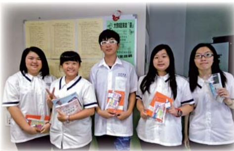
▲「大家E起來找查」活動