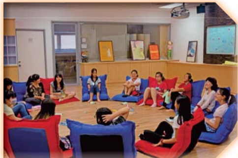
▲輔導工作坊假日活動