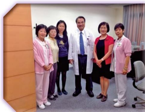
▲拜訪成大醫院副院長與護理部長