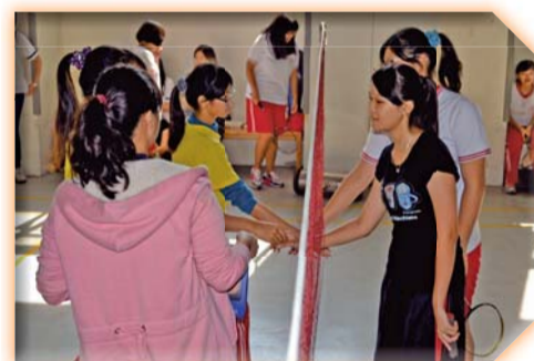
▲羽球比賽—君子之爭