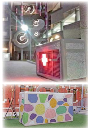
▲「靚·生·活」追尋生命中美好的歷程；鼓舞師生努力不懈