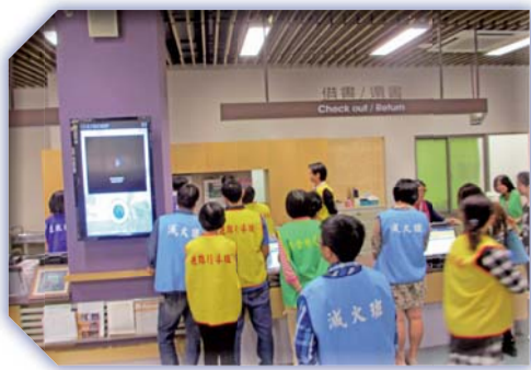
▲地震與自衛編組訓練現場教學