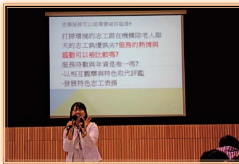
▲基礎服務學習講座—志願服務法規