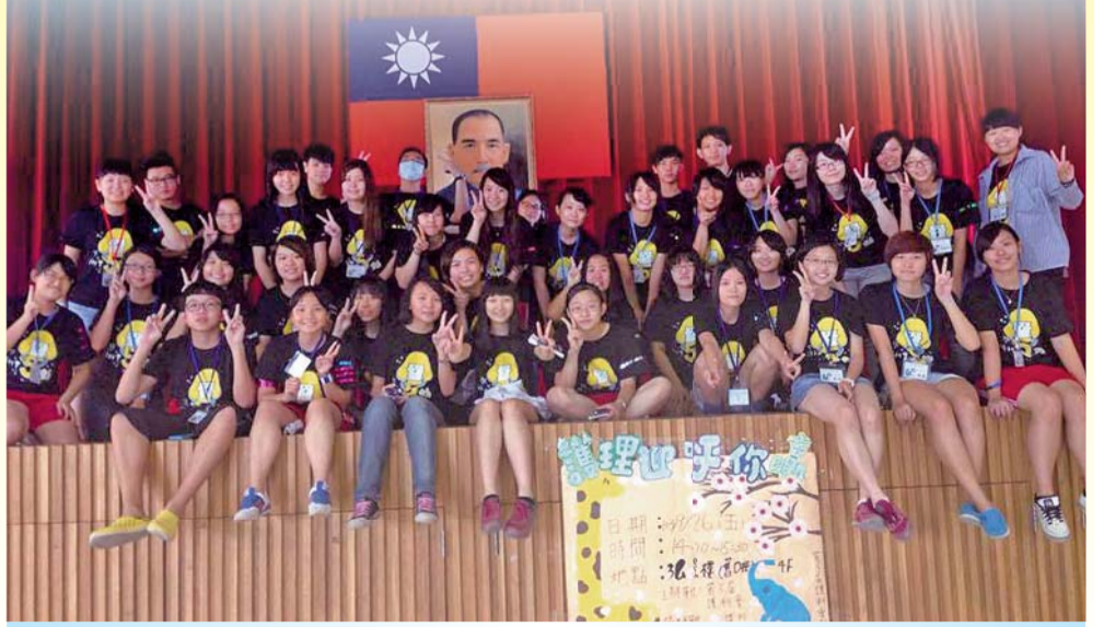
▲「護理迎呼你贏」讓新生快速熟悉校園