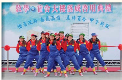
▲熱舞社表演—活力十足