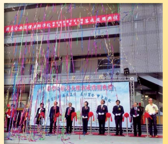
▲落成典禮剪綵嘉賓共迎南護新校園啓用