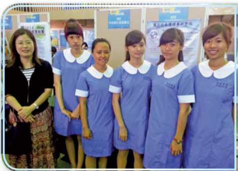
▲萬潤2014創新創意競賽獲獎師生合影