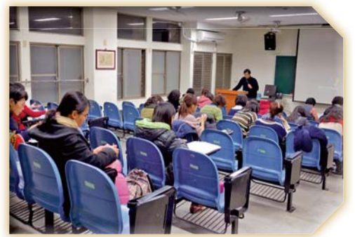
▲社工師輔考上課實況