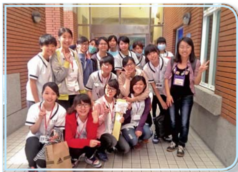
▲四年二班同學精神科服務學習活動後合影