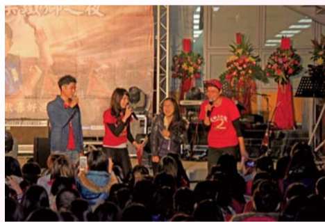
▲鐵獅玉玲瓏班底與同學互動妙趣橫生