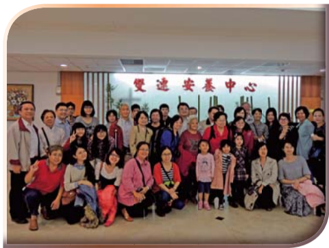
▲雙連安養中心參訪後合影