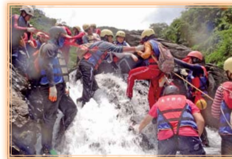
▲溯溪—同心協力向上爬