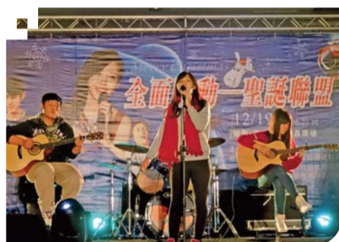
▲「全面啟動—聖誕聯盟」聖誕晚會活動—熱音社表演帶動校園溫馨氛圍