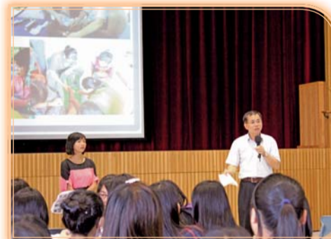
▲基礎服務學習講座—志願服務經驗分享