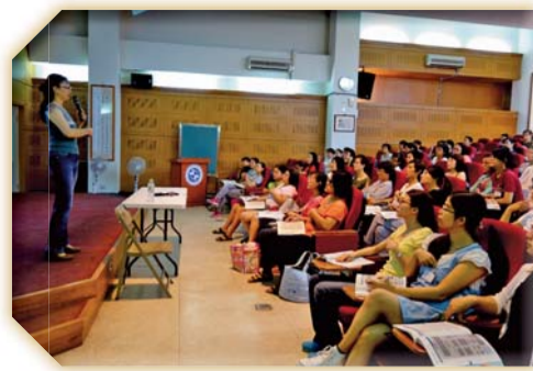
▲ACLS高級心臟救命術上課實況