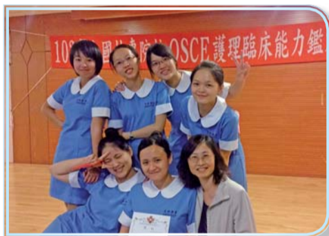
▲美和OSCE護理臨床能力鑑定競賽獲獎師生合影