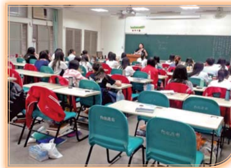
▲第一期英檢聽講班—講解課文