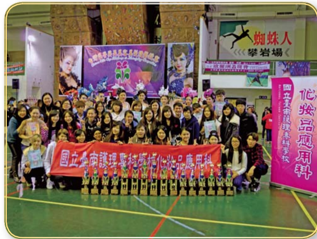
▲台灣菁英盃美容美髮技藝競賽後合影