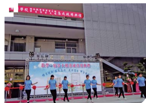
▲教學暨宿舍大樓落成啟用典禮—康輔社表演「香水百合」