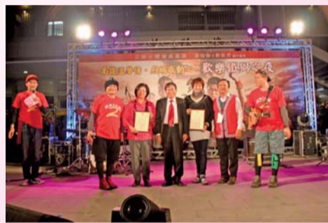
▲校長與愛心慈善團體代表合照