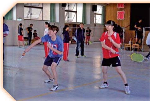
▲羽球比賽選手實力雄厚戰況激烈