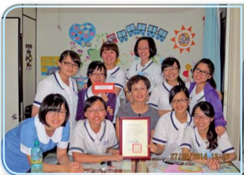
▲衛教宣導踩街競賽獲獎師生合影