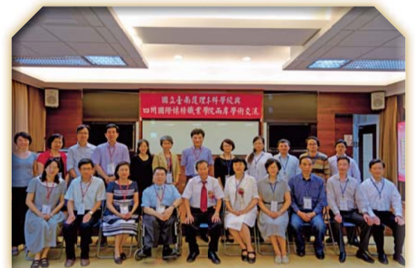
▲本校與四川國際標榜職業學院學術交流大合照