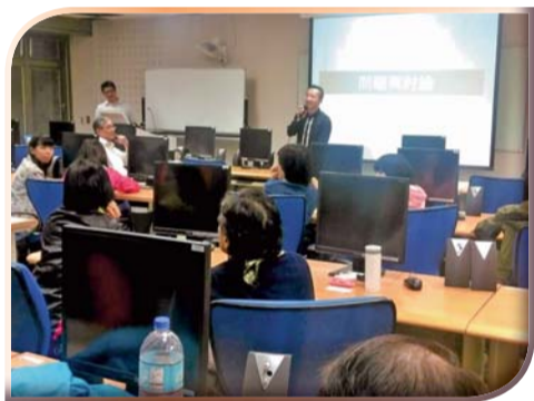
▲「教師銀髮照顧與服務課程創意e化教學」一講師與學員經驗討論與分享