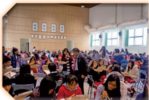
▲家庭日活動校長蒞臨參加與學生話家常