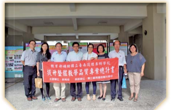
▲103年度提升教學品質計畫成果海報展