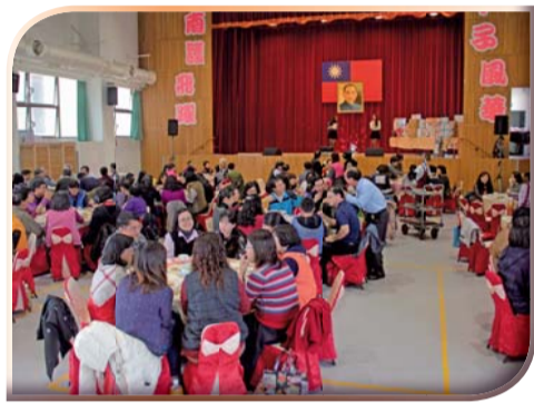
▲104年新春聯歡活動一聚餐