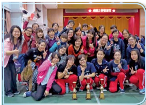
▲中護盃CPR接力賽獲獎師生合影