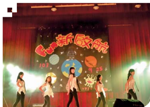
▲「Fun新啟航」迎新晚會活動—活力有氣社表演