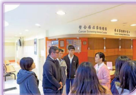
▲參訪臺北醫學大學附設醫院