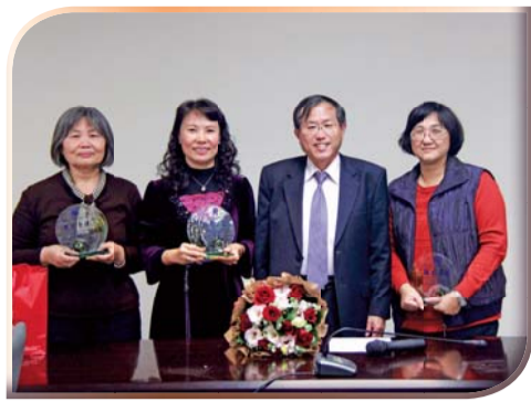
▲校長與退休人員合影