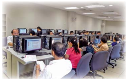
▲EndNote書目管理教育訓練

圖書館為強化師生資訊素養，養成學生廣泛閱讀習慣，培養人文關懷，舉辦電子資源教育訓練、資料查找、主題書展及真情傳遞等活動，營造溫馨校園。