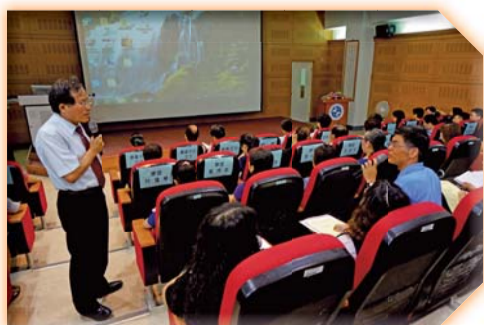
▲新生家長座談會—校長回答新生家長問題