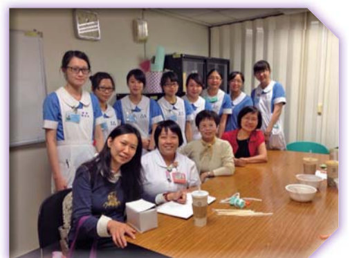
▲校外實習關懷訪視學生