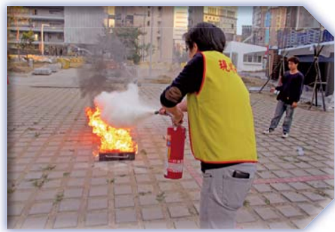
▲滅火器操作教學與演練