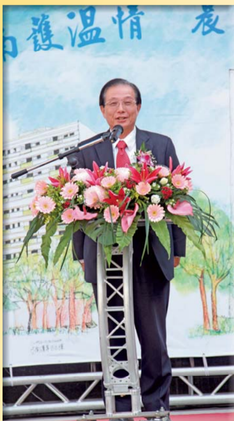
▲前教育部長吳清基蒞臨剪綵並致詞勉勵全校師生