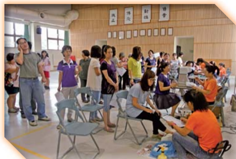
▲教職員工健康檢查