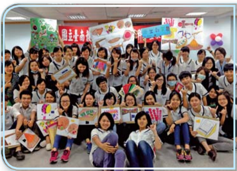
▲四年六班同學長照服務學習活動後合影