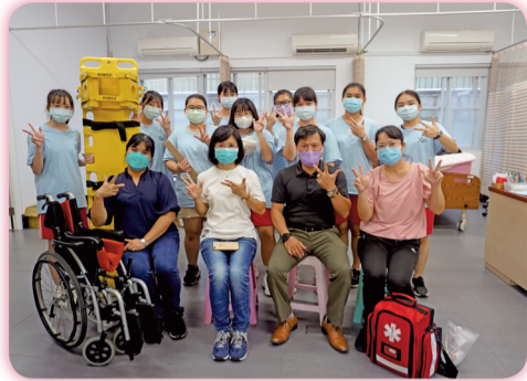
▲ 921防災演練實際救護操演

另外，為響應12月1日世界愛滋日，將12月的第1週訂「愛滋防治宣導主題週」，透過「我的性福我作主（身體自主權及性教育議題）」專題演講、「愛滋防治（含性教育）」入班宣導、「世界愛滋 為愛篩檢」拍照打卡快閃活動、各班愛滋影片賞析討論，以及邀請中西區衛生所到校設攤，免費愛滋匿名篩檢抽血等一系列的活動，讓學生透過學習，了解自己、尊重他人、愛滋零歧視等健康態度行為，落實聯合國永續發展性別平等，讓性別無礙，健康均平。