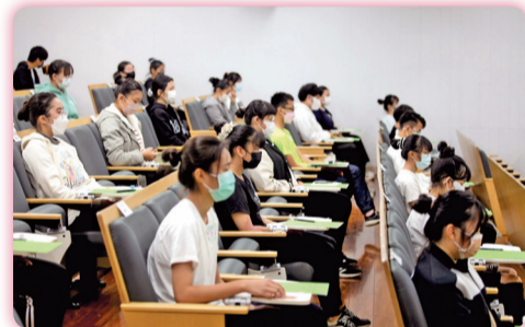
▲ 國中技藝競賽學科考試