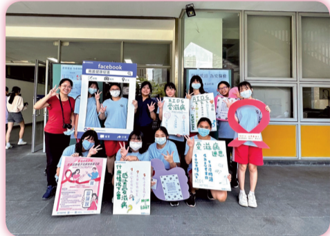
▲ 響應世界愛滋 為愛篩檢活動