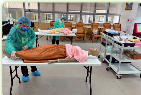
▲學生進行殯葬實務操作