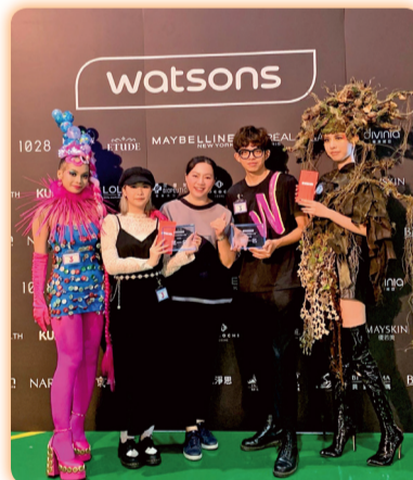
▲勇奪2022屈臣氏彩妝競賽雙料冠軍