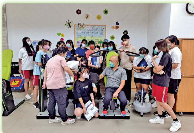
▲證照輔導課程，學生習得健康知識並進行機器操作