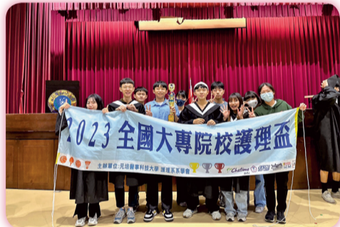
▲ 羽球隊參加2023全國大專院校護理盃羽球賽獲團體組第三名