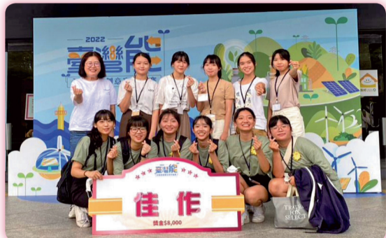
▲「2022年臺灣能—永續能源創意實作競賽」獲獎師生合影