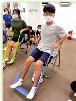
▲學生學習銀髮族活動指導知識及實務技術操作練習