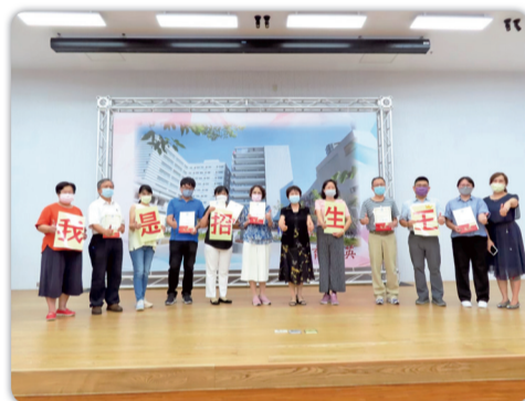
▲招生宣導獎勵「我是招生王」