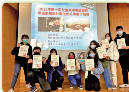
▲學生參加第七屆全國高中職銀髮族樂活創意設計與生命故事製作競賽，榮獲佳績