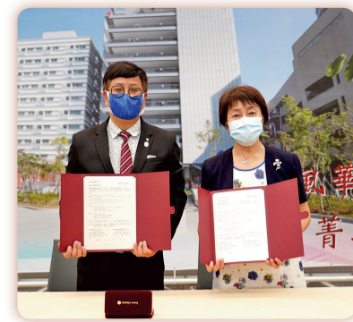
▲本校與智泰科技產學合作簽訂暨軟體捐贈儀式