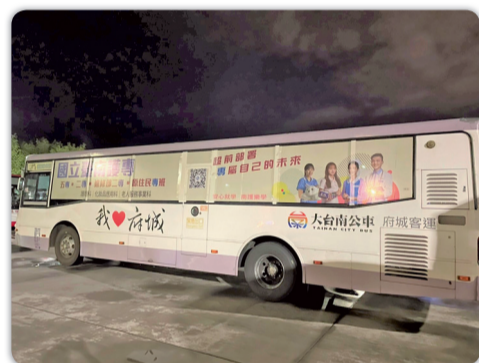
▲「超前部署·專屬自己的未來」五專、二專公車廣告