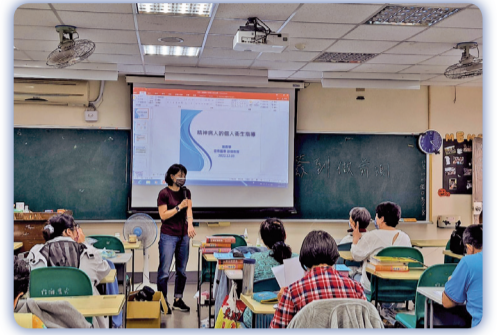
▲ 精神疾病患者照顧服務訓練班