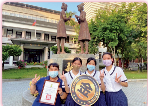
▲「2022大家來爭光 健康好靈光」獲獎師生合影