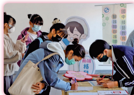
▲ 國中技藝競賽選手報到

護理科承接臺南市教育局舉辦的國中技藝教育競賽醫護職群「護理基本工作」主題。此次為本校第二次承辦，於112年2月1日舉行，共有臺南市11所國中41位選手參與，指導學校為中華醫事科技大學、敏惠醫護管理專科學校、樹人醫護管理專科學校。競賽術科題目為「傷口換藥」及「濕洗手法」。本次競賽錄取第一至六名，以及五位佳作學生，由教育局核發獎狀。