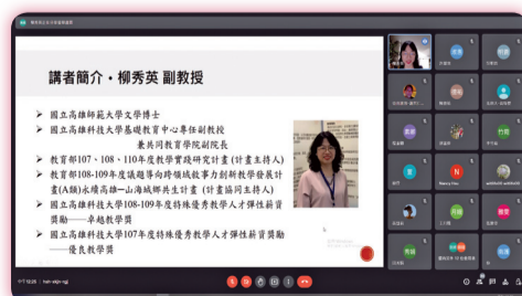
▲ 課程革新與教學實踐的經驗分享講師介紹