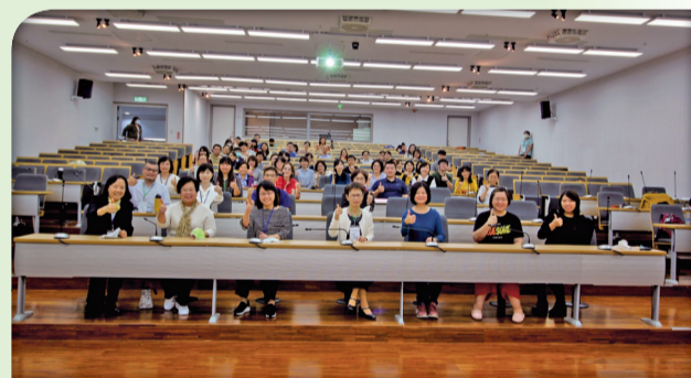
▲國際研討會-場次一

下午場共三個場次，分別是：創新預防延緩失能服務模式、跨域合作之失能個案與家屬照護、我國長期照護督導人員職能基準，由本校11位教師報告其研究成果。透過此次研討會，不僅翻轉與會者的照顧哲學，更激發創新照護模式，帶給彼此嶄新的視野及觀點上的成長。