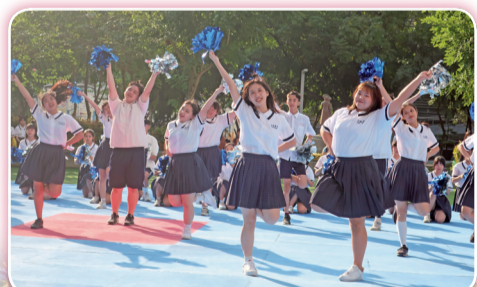
▲ 111學年度班際趣味啦啦舞競賽