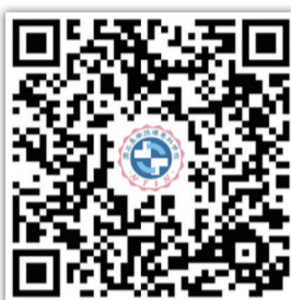
▲「影音 / 說明會」專區

透過多元宣傳方式，增加學校曝光度，包含公車車體廣告、電視牆短片等。同時為獎勵教師同仁參與招生宣導，頒發「我是招生王」獎狀，藉此表達感謝。