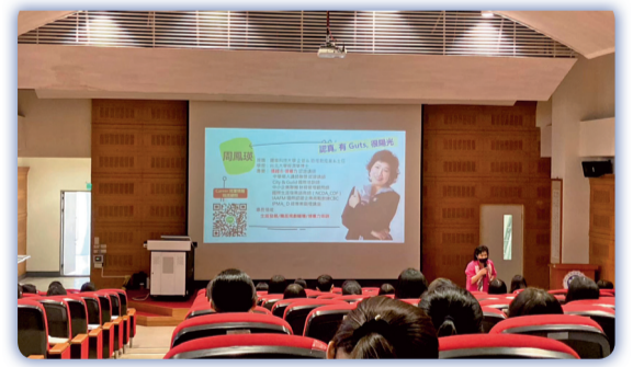
▲ 辦理「面試的技巧」實體講座