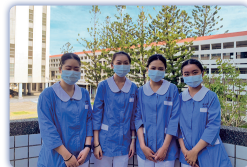
▲「全國南區分區技能競賽(英文技術試題)」，榮獲佳作