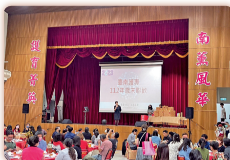
▲同仁共度歡樂圓滿時光

為慰勞同仁平日工作之辛勞並促進情感交流，於112年1月13日中午在弘景樓4樓舉辦歲末聯歡活動，內容包含圓滿團圓餐會、福樂滿點摸彩及開懷歡唱，讓大家共享年節喜樂氛圍。參加人員計196位，其中有18位退休人員回校歡聚，期盼大家在新的一年圓滿如意。