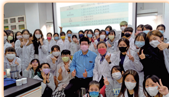
▲辦理演講「彩粧品蜜粉質實務分析與應用」