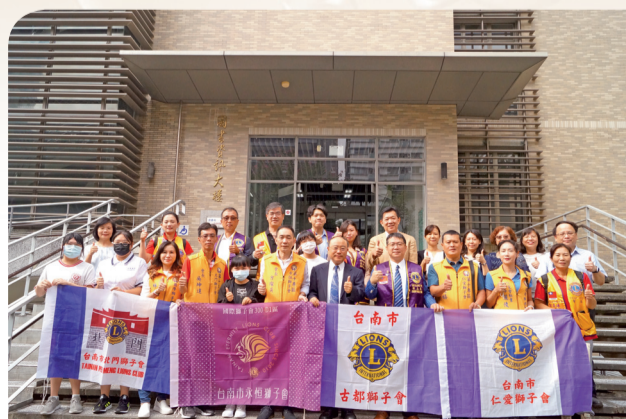
▲台南市古都獅子會捐贈本校清寒獎助學金10萬元

得更豐沛的資源，讓校務的推動更為順利。（111年度捐贈明細，詳見秘書室網頁「捐款芳名錄」 https://secretariat.nitn.edu.tw/donate_record.aspx ）