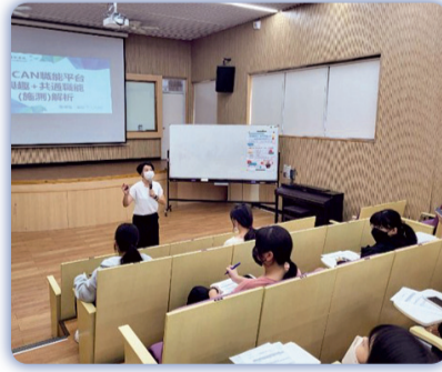
▲ 辦理「UCAN解測-職業興趣探索及共通職能解析（I）（II）」講座