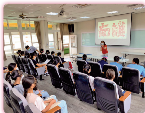
▲至澎湖縣文光國中宣導

為擴大本校能見度，招收適才適性之新生，本校首次前往澎湖縣文光國中、馬公國中舉辦招生說明會，同學反應踴躍，展現強烈入學意願。另外，亦前往南投縣宏仁國中、埔里國中、大成國中，積極走進偏鄉及原住民重點學校，宣導本校培訓技職專長之特色，以及弱勢助學、安心就學等措施。