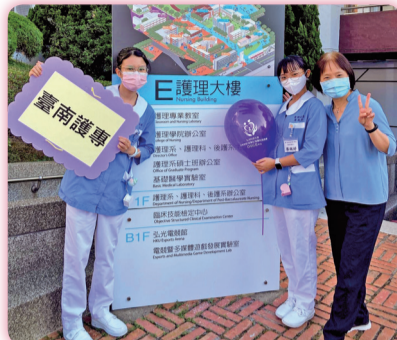
▲「111年臺灣技優護生實作競賽」獲獎師生合影