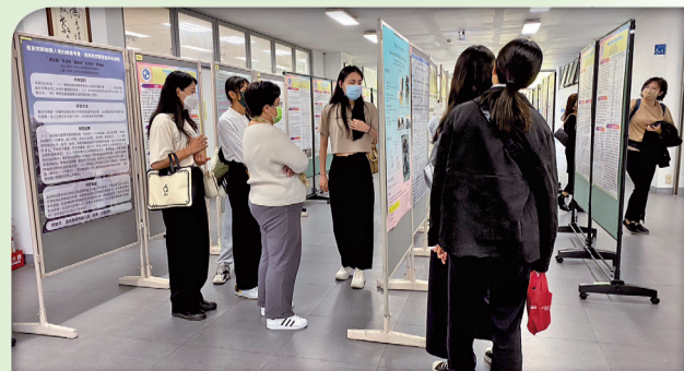
▲國際研討會-海報論文會場