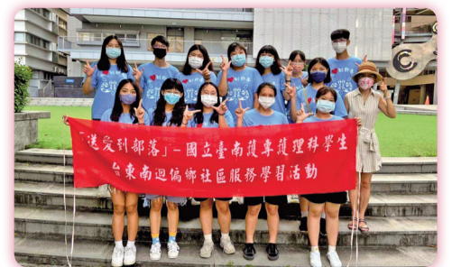
▶ 志工團出發在校園合影

坂、愛國蒲、安朔、加津林等五個文化健康站。期望藉由活動讓部落裡的居民獲得激勵，同時提升部落的保健知能，而學生經由服務的過程，發揮護理科的專業，讓護理人的愛心源源不絕地送到部落。