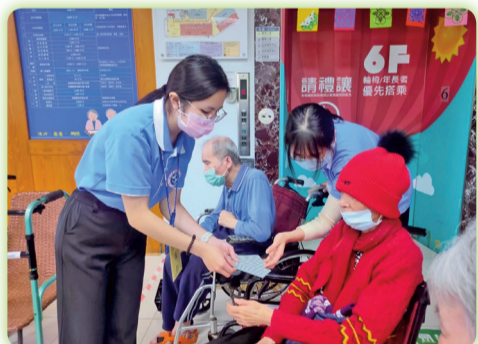
▲老服科學生於機構進行社工方案實習

辦理學生寒假社工方案實習、社區體適能檢測活動、高齡者精準健身指導員、銀髮族功能性體適能指導員、喪禮服務人員丙級技術士證照輔導課程、智慧銀髮健身房歲末聯歡活動等課程及活動。另外，帶領學生參與「2022年第七屆全國高中職銀髮族樂活創意設計與生命故事製作競賽」，榮獲佳績。