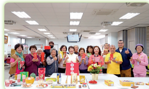
▲校長與LOHAS教學研究中心長輩們進行歲末聯歡同樂