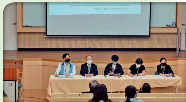
▲國際研討會-場次三