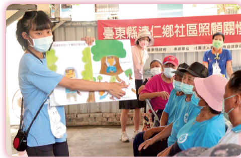
▲ 志工以繪本向長輩進行衛教宣導