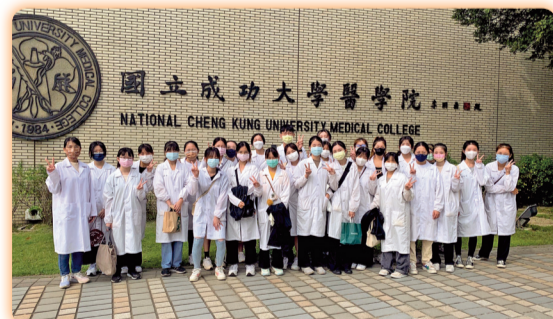
▲辦理校外教學參訪「大體解剖教室」