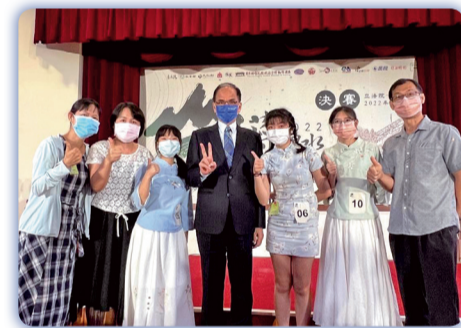
▲2022蔣渭水台語·客語漢詩吟唱比賽，均獲佳作殊榮