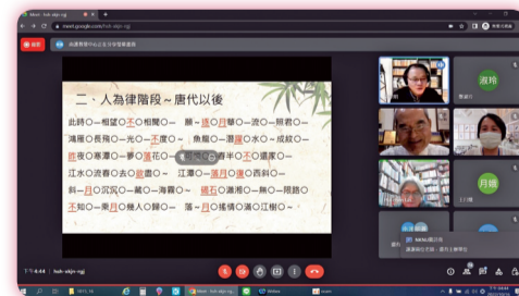
▲ 閩南語推廣研習營