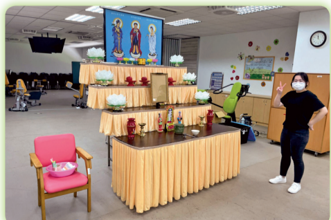
▲喪禮服務人員丙級技術士證照輔導課程