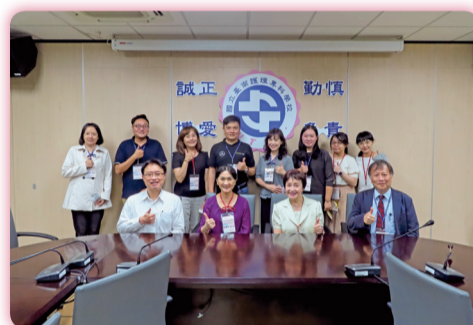
▲111年度技專校院招生專業化實地輔導

111年度技專校院招生專業化總辦公室於111年11月30日至本校辦理招生專業化實地輔導，對本校二專招生率達100%，以及計畫執行五大評核指標執行率皆達100%，表達肯定。