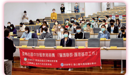
▲ 國中技藝競賽開幕儀式