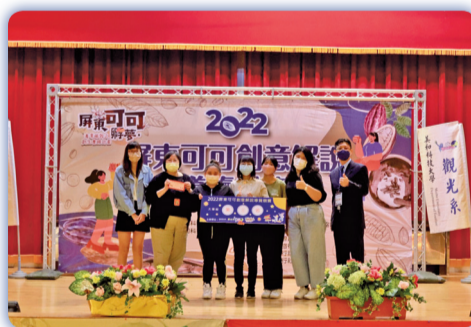
▲參加「2022屏東可可創意解說導覽競賽」榮獲大專組第三名