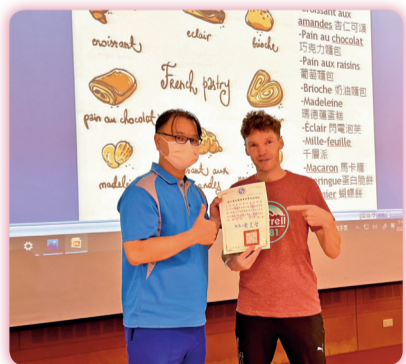
▲ 語言學習、文化交流講座「法國製臺灣米」致贈講者感謝狀與大合照