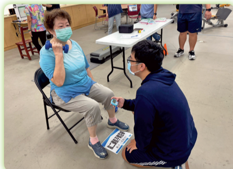
▲學生指導長輩動作正確性及協助進行檢測