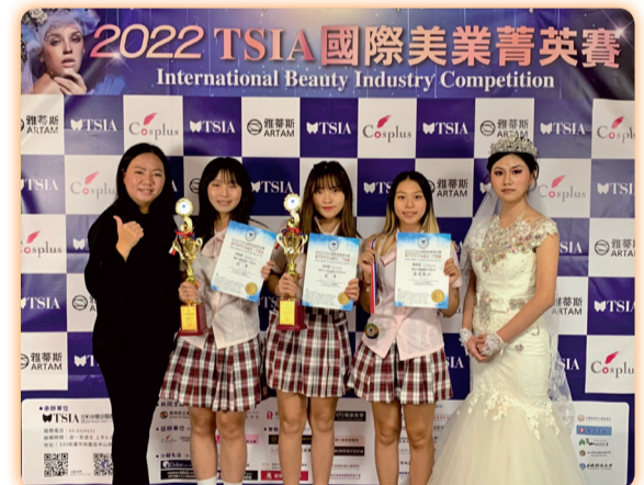
▲越南、新加坡、韓國、印尼、泰國等國家參賽的2022 TSIA國際美業菁英賽獲得雙冠軍