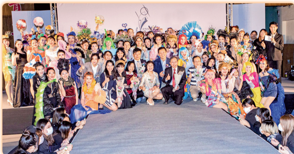
▲第9屆五專五畢展主題「Epoch時光」

靜態展演包含化妝品科技及美容技術兩類，科技組學生從化妝品產品企劃、配方選擇、調製與檢驗、有效性評估、品牌設計到宣傳擬定等，均是學生腦力激盪的成果；美容技術部分包含髮型設計、服飾美學、創意商品開發、手捧花設計、彩妝紙圖設計等，其中更囊括多項國內獎項與獎次，展現專業知識與實務技能。