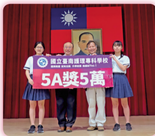
▲副校長及教務主任與111學年度五專優秀5A新生合影

111學年度獎勵優秀新生入學實施計畫及得獎名單如下，歡迎有志報考本校的學生，積極爭取各項高獎學金！