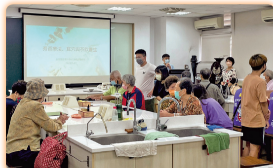
▲永華里銀同社區長者們參與「漢方膳食養生美容」課程

今年師生再次擇定「小雪」節氣的翌日（11月23日），邀請中西區永華里銀同社區長者們至學校中草藥養生專業教室，參與「漢方膳食養生美容」課程的進階服務學習，此次賴雅韻副教授與學生們第一次共同規劃讓長者體驗「養生茶療與芳療耳穴」。