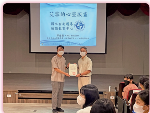
▲ 科普講座「艾雪的心靈版畫」致贈講者感謝狀