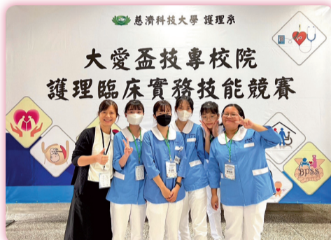
▲「2022第二屆大愛盃技專校院護理臨床實務技能競賽」獲獎師生合影