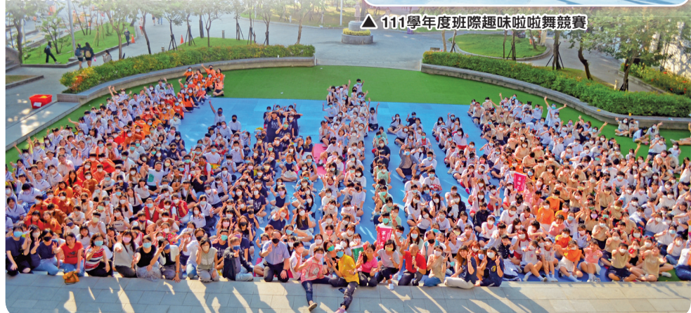
▲ 111學年度班際趣味啦啦舞競賽參賽人員大合照