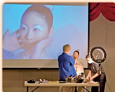
▲辦理「妝緻藝術」專題演講