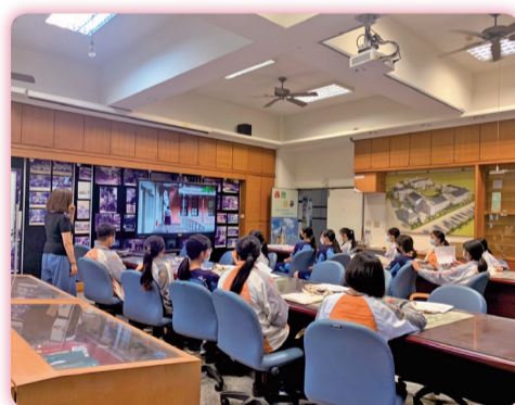
▲至南投縣埔里國中與同學互動