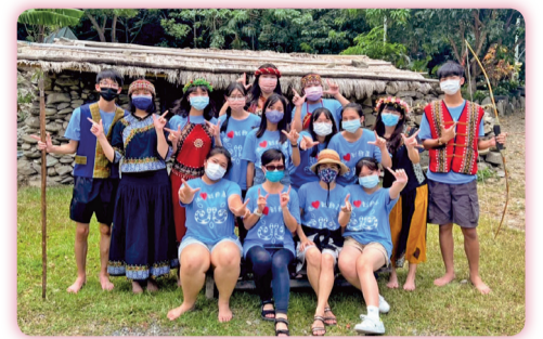
▲ 志工排灣族服體驗