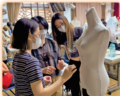
▲辦理職涯講座「基礎服飾研習」